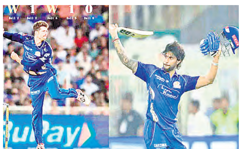
తెనాలియా (8), షారుక్ ఖాన్ (17)లు ఆశలు రేపారు. కానీ, తెనాలియాను అపే ఒకే ఓవర్లో రషీద్ ఖాన్ (4), షారుక్లను బెట్ చేసిన అశ్వనీ కుమార్ (4-24) గుజరాత్ ఆశలపై నీళ్లు చల్లాడు. రబడ (12) కాసిపు సోదాడినా సొంత ఎలెట్రా బెటర్లు గుజరాత్ వంద పరుగులకే కుప్పకూలింది.

వంకొమ్మిడో సీజన్లో ముంబయి ఇండియన్స్ రెండో విజయంతో మురిసింది. వరసగా నాలుగు ఓటమలనుంచి తేరుకున్న ముంబయికి తిలక్వర్కర్ (101 నాటిల్) సుపామ్ సెండరితో భారీ స్కోరునిచ్చింది.. బంతితో అశ్వనీ కుమార్ (4-24) గుజరాత్ ట్రిటన్స్ విడిచివేసిన కులాడు. ఈ సీజన్లో తొలి విజయంతో బుర్రా (1-15) గుజరాత్ పతనాన్ని మొదలెట్టగా కుర్రాడు అశ్వనీ వికెట్ల వేటతో ముంబయి గెలిపించాడు. 200 పరుగుల ఫేదనలో పరిమితమైన గుజరాత్కు సొంత ప్రేక్షకుల సమక్షంలో భారీ ఓటమి చవిచూసింది. బదునాథ్ ఫాంపియన్ ముంబయి ఇండియన్స్ గెలుపు తోపాటు అశ్వనీ అతడికి మొదటి వికెట్ కాగా.. ప్రవాహకరమైన బట్లర్ (5)ను పొందాడు బోల్కా కొండెం. టామ్ అర్డర్ వైఫల్యంతో షేక్ తిన్న గుజరాత్ను అశ్వనీ కుమార్ మరింత దెబ్బ తీస్తూ శుభముస్ గిల్ (14)ను వెనక్కి పంపాడు. కాంటర్లీ ఒకే ఓవర్లో సందర్ (26), డేంబర్నెస్ గ్రేస్ ఫిలిప్స్ (6) వికెట్లు తీసి గుజరాత్ను కచ్చితంగా నెట్టాడు. టబ్బాపా బదు వికెట్లు పడిన వెళ్ ఇంఫాన్ట్ నబ్ రాహాల్