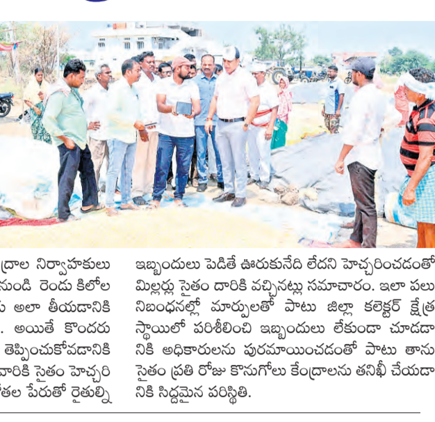
ధాన్యం కొనుగోళ్లపై దృష్టి పెట్టారు. ధాన్యం కొనుగోళ్ల సందర్భంగా గతంలో ఉన్న నిబంధనల్ని సైతం పూర్తిగా గతంలో ధాన్యం కొనుగోలు కేంద్రానికి తీసుకు వారు. ఇప్పుడు తేమ, తాలు లేకుండా ఆరబెట్టి తీసుకొచ్చిన ధాన్యానికి మాత్రమే బోక్స్ ఇవ్వనున్నారు. ఇది కాకుండా గతంలో కొనుగోలు కేంద్రాల నిర్వాహకులు సరకు, తాలు పేరుతో బస్సుకు కిలో నుండి రెండు కిలోల వరకు తీసుకు వారు. అయితే ఇప్పుడు అలా కుదరదని కలెక్టర్ తెల్పి చెప్పారు. అయితే కొందరు మిల్లర్లు తమ మిల్లలకు ధాన్యం తెప్పించుకోవడానికి ఇబ్బందిగా ఉన్న కలెక్టర్ మాత్రం వారికి సైతం హెచ్చరికలు జారీ చేసినట్లు తెలుస్తుంది. కోతల పేరుతో రైతుల్ని ఇబ్బందులు పెడితే ఊరుకునేది లేదని హెచ్చరించడంతో మిల్లర్లు సైతం దారికి వచ్చినట్లు సమాచారం. ఇలా పలు నిబంధనల్లో మార్పులతో పాటు జిల్లా కలెక్టర్ క్షేత్ర స్థాయిలో పరిశీలించి ఇబ్బందులు లేకుండా చూడడానికి అధికారులను పురమాయించడంతో పాటు శాసన సైతం ప్రతి రోజు కొనుగోలు కేంద్రాలను తనిఖీ చేయడానికి నిర్ణయించినట్లు తెలుస్తుంది.

నిమవారం నుండి లాంచనంగా జిల్లాలో ధాన్యం కొనుగోళ్ల ప్రారంభించారు. మంగళవారం లింగామనపల్ల రంబోలి పలు గ్రామాలలో ధాన్యం కొనుగోళ్లను పరిశీలించి నిబంధనల తప్పక పాటించాలని హెచ్చరించారు. జనగామ జిల్లాలో ఈ ఏడాది విస్తారంగా పరి సాగు చేశారు. సుమారు రెండు లక్షల మెట్రిక్ టన్నులకు పైగా ధాన్యం దిగుబడి అయ్యి అవకాశాలు ఉన్నాయని అధికారులు అంచనా వేశారు. ఇందు కోసం జిల్లాలో 236 కొనుగోలు కేంద్రాలకు ప్రణాళిక సిద్ధం చేయగా ఇప్పటికి 60 శాతానికి పైగా కొనుగోలు కేంద్రాలు ప్రారంభించారు. ప్రభుత్వ నిబంధనల విషయంలో గతంలో కొంత ఊహానికంగా వ్యవహరించినా ఈ ఏడాది మాత్రం పక ధృవంగా నిబంధనలు పాటించాలని జిల్లా కలెక్టర్ అధికారులను ఆదేశించారు. ఇందుకు నిబంధించిన నమోదైన సైతం పూర్తి చేశారు. ఇప్పుడు అధికారులు పూర్తిగా ధాన్యం కొనుగోళ్ల ప్రక్రియలో నిమగ్నమై ఉన్నారు.