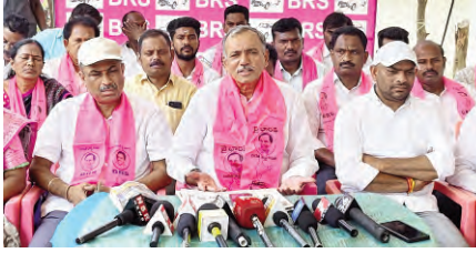
ఇంత త్వరగా ప్రజా ధరణ కోల్పోతున్న సీఎంసూ చూడడం ఇదే మొదటి సారి అన్నారు.. బీఆర్ఎస్ ప్రభుత్వ హయాంలో రైతులు ఆనందంగా ఉన్నారని, కాంగ్రెస్ పాలనలో రైతులు హరిగోసలు పడుతున్నారన్నారు. అన్నదాతలకు పెట్టుబడి సాయం ముట్టుబడిగా అందుతుందని ఆరోపించారు. ఇప్పటికైనా ప్రజల మధ్య తిరుగుతే కాంగ్రెస్ ప్రభుత్వం పట్ల వ్యతిరేకత ఎంత ఉందో ముఖ్యమంత్రి కి అర్థమవుతుందన్నారు. ఎన్నికల్లో ఇచ్చిన హామీలను కాంగ్రెస్ ప్రభుత్వం నెరవేర్చాలని డిమాండ్ చేశారు. ఈ కార్యక్రమంలో బిఆర్ఎస్ పార్టీ నాయకులు, కౌన్సిలర్లు తదితరులు పాల్గొన్నారు.