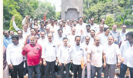
గనపార్క్ అమరవరుల స్థాపన వద్ద ఆర్టిసి జెఎస్ నేతల నివాళి

నేడు ఉ.5 గంటల నుంచి రాష్ట్రవ్యాప్తంగా మహాధర్మాలు ఆర్టిసి జెఎస్ పిలుపు రాష్ట్రవ్యాప్తంగా గురువారం ఉదయం ఐదుగంటల నుండి అన్ని ఆర్టిసి డిపోలు, యూనిట్లు, పర్మిట్లలో మహాధర్మాలు నిర్వహించనున్నట్లు ఆర్టిసి జెఎస్ ప్రకటించింది. బుధవారం సమూహ పోల్డర్ల విజయవంతం చేసిన ఆర్టిసి కార్మికులకు జెఎస్ అభినందనలు తెలియజేసింది. "ప్రభుత్వం, యాజ మాన్యం సమ్మె డిమాండ్లను పరిష్కరించకుండా మొండిగా వ్యవ హరిస్తూ దాటవేత ధోరణి అవలంబిస్తూ ప్రజలను ఆర్టిసి కార్మికుల వ్యతిరేకంగా ఉద్దేశించింది. మంగళవారం జరిగిన చర్చలలో 32 డిమాండ్లపై సుదీర్ఘ చర్చ తరువాతి 2లో