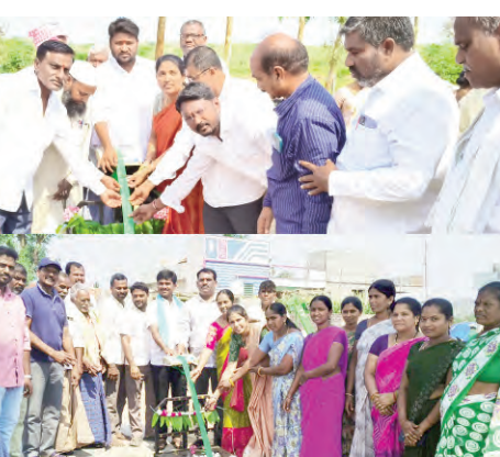
వారు మాట్లాడుతూ రైతులు దళారు ప్రభుత్వం కల్పించే మద్దతు ధరను లను సమ్మి మోసపోవద్దని, వినియోగించుకోవాలని తెలిపారు.