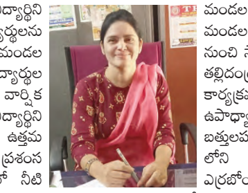
పాఠశాలల్లో విద్యార్థులతో ఉపాధ్యాయులు వారి తల్లిదండ్రులతో సమీక్ష సమావేశం నిర్వహించారు.

ప్రజాపక్షం/కల్లూరు: వేసవి సెలవులను విద్యార్థిని విద్యార్థులు సద్వినియోగం చేసుకోవాలని విద్యార్థులను ఎంకాటి నివేదిత కోరారు. ఈ సందర్భంగా మండల పరిధిలోని పలు ప్రభుత్వ పాఠశాలల్లో విద్యార్థుల తల్లిదండ్రుల తో సమీక్ష సమావేశం జరిగింది. వార్షిక పరీక్షల్లో అత్యుత్తమ ఫలితాలు సాధించిన విద్యార్థిని విద్యార్థులకు ప్రగతి పత్రాలను అందించి ఉత్తమ ఫలితాలను సాధించిన వారికి ఘన సన్మానం చేసే ప్రశంస పత్రాలను అందించారు. విద్యార్థులు వేసవిలో నీటి వనరుల వద్దకు వెళ్ళవద్దని వారిని పంపించవద్దని తల్లిదండ్రులకు తెలిపారు. విద్యార్థులు వేసవిలో నడవడికలను గమనిస్తూ ఉండాలని