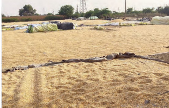
అరకొర కేంద్రాలు.. చాలీ చాలని గన్నీ బ్యాగులు..

మక్కల కొనుగోళ్లలో సర్కారు వెనక్కు తగ్గడం హాట్ టాపిక్ గా మారింది. రైతులు పండించిన పంటలో సగమే కొంటామని ఏకంగా ప్రభుత్వమే ప్రకటన చేయడం విద్వంసంగా కనిపిస్తోంది. ఈ అంశంపై ప్రతిపక్షాలు సైతం సర్కారుపై గురుగా ఉన్నాయి. నెత్తిబిని చెమటగా మార్చి రైతులు పండించిన పంటను కొనే దిక్కులేని దిక్కుమాలిన ముఖ్యమంత్రి దిగిపోవాలని కాంగ్రెస్ సత్య పార్టీలన్నీ దుమ్మెత్తిపోస్తున్నాయి. మక్కల కొనుగోలు విషయంలో రాష్ట్ర ప్రభుత్వం చేసిన ప్రకటనతో జిల్లాలో రైతుల గుండెల్లో రాయి పడింది. ఇటీవల జిల్లా రైతాంగం మొక్కజొన్నను ప్రధాన వాణిజ్య పంటగా మార్చుకున్నారు. గతంలో పత్తి, మిర్చి వేసే రైతులు సైతం మొక్కజొన్న పంటపై ఆసక్తి చూపుతూ ఈసారి మక్కల సాగుకు మొగ్గు చూపారు. జిల్లా వ్యాప్తంగా ఒక లక్షా 40 వేల ఎకరాల విస్తీర్ణంలో రైతులు మొక్కజొన్నను సాగు చేశారు. ఈసారి మునుపెన్నడూ లేనివిధంగా జిల్లా కేంద్రానికి సమీపంలో ఉన్న కొణిజర్ల మండలంలో 22 వేల ఎకరాల్లో మక్కలను సాగు చేశారు. దీంతో జిల్లాలో దిగుబడి బాగా పెరిగింది. ఎకరాకు సుమారు 40 నుంచి 45 క్వీంటాళ్ల వరకు పంట దిగుబడి రావడంతో రైతులు తమ కష్టాలు తీరుతాయన్న ఆశాభావంతో ఉన్నారు.