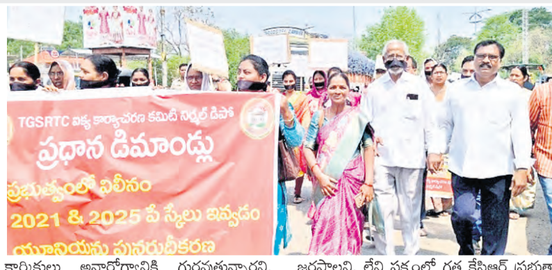
కార్మికులు అసాధారణంగా గుర్తుపట్టారని, ముఖ్యంగా గుండె జబ్బులతో ప్రాణాలు కోల్పోయారని మండిపడ్డారు. లాభాధార్థం కోసం కాకుండా సేవా దృక్పథంతో పనిచేస్తున్న సంస్థలో కార్మికులను పట్టించుకోవాలని ఆయన పిలుపునిచ్చారు.

ప్రజాపక్షం/నిర్మల్ రూరల్ : రాష్ట్ర వ్యాప్తంగా ఆర్టీసీ కార్మికులు తమ న్యాయమైన డిమాండ్ల సాధన కోసం జీవితం పట్టుకుంటున్నారని ప్రభుత్వంపై మరణాలకు రేపంట్ రెడ్డి సర్కార్ల పూర్తి బాధ్యత వహించాలని తీవ్రస్థాయిలో దృఢపెట్టారు.