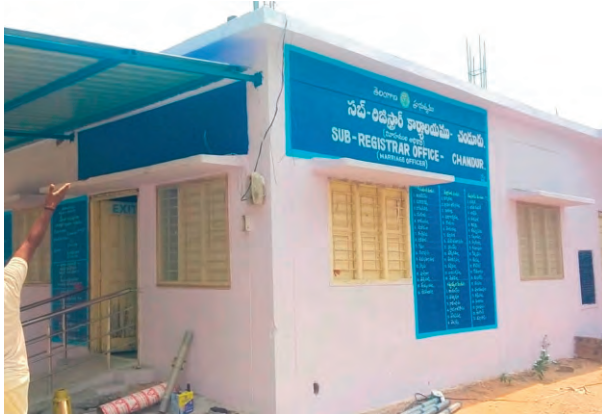
రోజున అంగడిపేటలోని నూతన భవనంలో చందూరు సబ్ రిజిస్ట్రార్ కార్యాలయం కార్యకలాపాలు కొనసాగించే విధంగా అన్ని ఏర్పాట్లు చేస్తున్నట్లు విశ్వసన

ప్రజాపక్షం/చందూరు: చందూరు మున్సిపాలిటీ కేంద్రంలో ఉన్న సబ్ రిజిస్ట్రార్ కార్యాలయం త్వరలో మున్సిపాలిటీ పరిధిలోని అంగడిపేటకు మార్పుకానుంది. చందూరులో ప్రభుత్వ భవనంలో కాకుండా అద్దె భవనంలో సబ్ రిజిస్ట్రార్ కార్యాలయం ఉన్నది. అన్ని ప్రభుత్వ కార్యాలయాలు ఖాళీగా ఉన్న ప్రభుత్వ భవనాలలోకి మార్చాలని ప్రభుత్వం అదేశాలు జారీచేయడంతో అద్దె భవనంలో ఉన్న సబ్ రిజిస్ట్రార్ కార్యాలయాన్ని ప్రభుత్వ భవనంలోకి మార్చాలని ప్రభుత్వం నిర్ణయించింది. ఇప్పటికే అద్దె భవనంలో ఉన్న ఎక్సైజ్ కార్యాలయంను కూడా అంగడిపేటలోని పాత గ్రామ పంచాయితీ భవనంలోకి తరలించారు. అంగడిపేట గ్రామం చందూరు మున్సిపాలిటీలో విలీనం కావడంతో అక్కడ నూతనంగా నిర్మించిన గ్రామ పంచాయితీ భవనం కూడా ఖాళీగా ఉన్నది. నూతనంగా నిర్మించిన ఈ భవనంలో సబ్ రిజిస్ట్రార్ కార్యాలయం ఏర్పాటుకు అన్ని వసతులు ఉండడంతో సంబంధిత అధికారులు ఇక్కడ సబ్ రిజిస్ట్రార్ కార్యాలయం ఏర్పాటు చేయటంకు అన్ని ఏర్పాట్లు చేస్తున్నారు. మే 3 సోమవారం