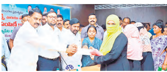
పేదింటి ఆడబద్దల కుటుంబాల్లో వెలుగుల్ లక్ష్మం