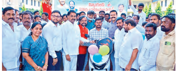
దివ్యాంగులు ఆత్మవిశ్వాసంతో ముందుకు