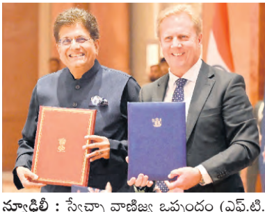
న్యూజిలాండ్ : స్వేచ్ఛా వాణిజ్య ఒప్పందం (ఎఫ్.టి.ఎ)పై భారత్-న్యూజిలాండ్ సంతకాలు చేశాయి. ఈ ఏడాది డిసెంబరునాటికి ఈ ఒప్పందం అమలులోకి వస్తుంది. ఈ మేరకు న్యూజిలాండ్ డిప్యూటీ ప్రైమ్ మినిస్టరు సుంకాలు

● ఎఫ్ టి ఏపై వాణిజ్య మంత్రుల సంతకాలు ● రైతులు, యువకులు, మహిళలు, స్టార్టప్ లకు గొప్ప లాభం: మోడీ ● పెట్టుబడులు, నైపుణ్యపుష్టి, ఉపాధి అవకాశాలు: గోయల్ ● డైరైవేజ్ పన్నునివల వాణిజ్య బదిలీలో ఐదు బిలియన్ డాలర్లు ● వస్త్రాలు, రత్నాలు, అభరణాలు, తోలు వస్తువులను హా ● సుంకాలు లేకుండా నూటికి సుంకాశం భారత్ ఎగుమతులు ● ఎఫ్ టి ఏపై వాణిజ్య మంత్రుల సంతకాలు, మహిళలు, స్టార్టప్ లకు గొప్ప లాభం: మోడీ ● పెట్టుబడులు, నైపుణ్యపుష్టి, ఉపాధి అవకాశాలు: గోయల్ ● డైరైవేజ్ పన్నునివల వాణిజ్య బదిలీలో ఐదు బిలియన్ డాలర్లు ● వస్త్రాలు, రత్నాలు, అభరణాలు, తోలు వస్తువులను హా ● సుంకాలు లేకుండా నూటికి సుంకాశం భారత్ ఎగుమతులు