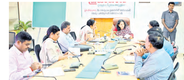
ప్రజాపక్షం/హైదరాబాద్: ఓటర్ జాబితా ప్రత్యేక ఇంటిస్పెన్ రివిజన్ (ఎన్ఐఆర్) పనులను నిర్దిష్ట గడువులోగా పూర్తి చేయాలని హైదరాబాద్ జిల్లా ఎన్నికల అధికారి, జిహెచ్ఎంసీ కమిషనర్ ఆర్.వి. కర్ణన్ ఆదేశించారు. ఈ ఆర్డీలు, వికారేటిలో నిర్వహించిన సమీక్షలో ఆయన మాట్లాడుతూ ప్రతి బిఎన్ఐ. రోజుకు 100 మంది ఓటర్లను, సూపర్వైజర్ 1000 మంది ఓటర్లను మ్యాపింగ్ చేయాలని లక్ష్యాన్ని నిర్దేశించారు. మే 5వ తేదీలోపు ఈ ప్రక్రియను పంప శాతం పూర్తి చేయాలని స్పష్టం చేశారు.

ప్రజాపక్షం/హైదరాబాద్: పౌరుల సమస్యలను వేగంగా పరిష్కరించేందుకు సైబరాబాద్ మున్సిపల్ కార్పొరేషన్ (సిఎస్) ప్రతి సోమవారం నిర్వహించే ప్రజావాణి కార్యక్రమంలో కమిషనర్ సుజల ప్రజల నుండి సేదగా ఫిర్యాదులు స్వీకరించి, వాటి పరిష్కారంపై అధికారులు ప్రత్యేక పాఠశాలను ఆదేశించారు. అందిన ప్రతి ఫిర్యాదును సమయం చేసి, రసీదు జారీ చేయడం తో పాటు, వాటి పురోగతిని నిరంతరం పర్యవేక్షించే విధానం అమలులో ఉందని అధికారులు తెలిపారు. ప్రతి ఫిర్యాదుకు ప్రత్యేక ట్రాకింగ్ ఐడి కేటాయింపడం ద్వారా పౌరులు తమ సమస్య స్థితిని సులభంగా తెలుసుకునే అవకాశం కల్పిస్తున్నారు. నేటి ప్రజావాణి కార్యక్రమంలో మొత్తం 44 ఫిర్యాదులు సమయం అయ్యాయి. వీటిలో టోన్ ఫ్లానింగ్ విభాగానికి చెందినవి అత్యధికంగా 34 కాగా, ఇంజనీరింగ్ విభాగానికి 5, రెవెన్యూ, ఆస్తి పన్ను విభాగానికి 2 ఫిర్యాదులు వచ్చాయి. పారిశుధ్యం, అర్బన్ కమ్యూనిటీ డెవలప్ మెంట్ (యుసిడి), అడ్వైజ్ మెంట్ విభాగాలకు ఒక్కో ఫిర్యాదు చొప్పున అందాయి. ప్రతి ఫిర్యాదును సమీక్షించి, వాటిని నిర్దిష్ట గడువులోగా పరిష్కరించాలని అధికారులను కమిషనర్ ఆదేశించారు. ఫిర్యాదు స్వీకరణ నుంచి పరిష్కారం వరకు ప్రతి దశలో బాధ్యతాయుతంగా వ్యవహరించాలని, ఎటువంటి జాప్యం లేకుండా