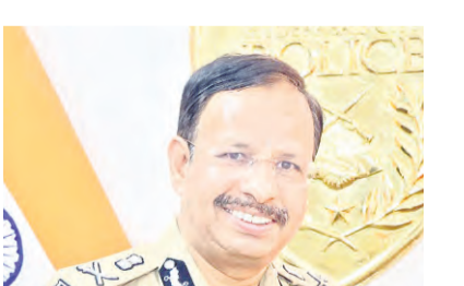
హైదరాబాద్ లో ఉంటున్న విదేశీయుల వివరాలు