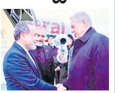
ఇరాన్ పై అమెరికా-ఇజ్రాయెల్ దురాక్రమణను నిలిపివేయడం, భవిష్యత్తులో ఇక దాడులు జరగకుండా ఆ రెండు దేశాల నుండి ఇరాన్ ఒక భద్రతాహామీ పొందడం, రెండవ దశ చర్యల్లో ఇరాన్-ఒమన్ దేశాల రెండూ సమస్యలు భాగస్వామ్యంతో హోర్నుజ్ జలసంధిని నిర్వహించేందుకు వీలుగా సమస్య పరిష్కారం, జలసంధిని రాకపోకలకు తెరిపించడం, ఈ రెండు దేశాల కలిసి హోర్నుజ్ జలసంధిని నిర్వహించడానికి ఒక న్యాయపరమైన నిబంధనల చట్టాన్ని రూపొందించడం. ఈ రెండు దశల చర్యల్లో ఈ అంశాలన్నీ పరిష్కారమైన తర్వాత ఇక చివరి మూడోదశ చర్యల్లో మాత్రమే ఇరాన్ కు సంబంధించిన అణు పదార్థం, అణుయుద్ధ సమస్యపై చర్యలు కొనసాగాలని, ఈ రెండుదశల చర్యలు పూర్తయ్యే వరకు ఇరాన్ కు ఇచ్చే అణు పదార్థంపై చర్యలు అణుపదార్థంపై చర్యలు

● అమెరికాకు చేరిన మూడు అంశాల ఇరాన్ కొత్త ప్రణాళిక ● తొలిదశలో అణు ఒప్పందం లేకుండా హోర్నుజ్ తెరవాల్సి ● దురాక్రమణ దాడుల నిలిపివేత-భద్రత హామీ ● ఇరాన్-ఒమన్ ఉమ్మడిగా హోర్నుజ్ నిర్వహణ ● చివరి దశలోనే అణుపదార్థంపై చర్య ● ఒప్పందం చేసుకోవాలని చర్యలు ఘర్షణ : ఇరాన్ ప్రకటన