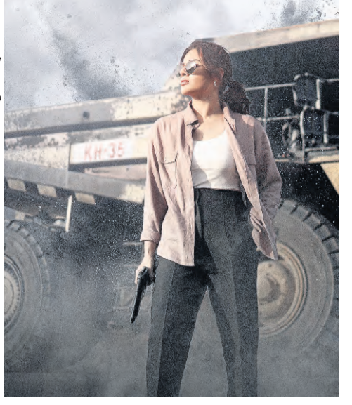
చిత్రానికి సహ నిర్మాత: సింధు మార్గెటి, డి.ఐ.సి; ఎ వనర్, సాహిత్యం: రామచంద్రారావు శాస్త్రి.

పట్టుకుని కనిపించడం ద్వారా ఆమె పాత్రలోని అగ్రేషన్ ని ప్రదర్శించే పనిలో. ఈ చిత్రాన్ని మంచిర్యాల, బెల్లంపల్లి, కాగజెన్ గర్, ఆదిలాబాద్ ప్రాంతాలతో పాటు హైదరాబాద్ లో ప్రత్యేకంగా నిర్మించిన సెట్లలో చిత్రీకరణ చేశారు. మొత్తం 60కి పైగా పార్ట్ లు దీనిలో చూడాలిగా హీరోయిన్లు వివేక్, ఐదు వనర్ ఫుల్ షెడ్యూల్ లో, 10కి పైగా భారీ సెట్లలో, రోజుకు 300 మందికి పైగా క్రూ మ్యాంబులూ చిత్రీకరణ జరిగింది. మేకింగ్ వీడియోలో ఈ ఎవర్ ఫుల్ చిత్రాన్ని, రావు రమేష్, నానర్, మనీష్ వాధ్వా, రాంకి, రవీంద్ర విజయ్, అరుణ్ కలం నరేష్, రవి, కృష్ణ చైతన్య, చంద్రిక రవి ముఖ్యమైన పాత్రలలో నటిస్తున్నారు. ఈ చిత్రానికి సామ్ సిఎస్ సంగీతం సమకాలాత్మకంగా, ఎ.ఎస్ సినిమాటోగ్రాఫీని నిర్మించారు. చోటా కె ప్రసాద్ ఎడిటింగ్, సాహ సురేష్ ప్రొడక్షన్ డిజైనింగ్ పనిచేస్తున్నారు. తెలుగు, హిందీ, తమిళం, మలయాళం, కన్నడ, భాషలలో పాస్ ఇండియన్ విడుదల కానుంది. ఈ