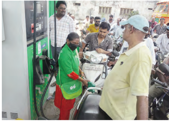
డిమాండ్ చేస్తున్నారు. సిండికేట్గా ఏర్పడి కృత్రిమ కొరత సృష్టిస్తున్న బంకుల లైసెన్సులు రద్దు చేసి కఠిన చర్యలు తీసుకోవాలని వాహనదారులు కోరుతున్నారు. నిత్యావసరమైన ఇంధనంతో జరుగుతున్న ఈ దోపిడీని అరికట్టకపోతే సామాన్యులపై మరింత భారం పడుతుందని ఆందోళన వ్యక్తం చేస్తున్నారు.

ఇంధన కొరత పేరుతో వాహనదారుల జేబులకు చిల్లులు పెడుతున్న అక్రమ వ్యాపారులపై, బ్లాక్ మార్కెట్కు ఇంధనం తరలిస్తున్న బంకుల యాజమాన్యాలపై అధికారులు తక్షణమే నిఘా పెంచాలని ప్రజలు