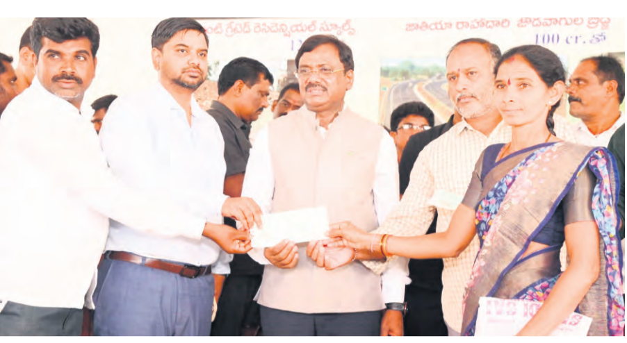
ఏర్పాటు చేసినట్లు వెల్లడించారు. భూ నిర్మాణశులకు 26 కోట్ల రూపాయల నష్టపరిహారం మంజూరు చేశా

ప్రజాపక్షం / చెన్నూరు:నిరుపేదలకు ప్రభుత్వం అందిస్తున్న ఇందిరమ్మ ఇండ్లు అర్హులైన ప్రతి ఒక్కరికీ కేటాయిస్తామని రాష్ట్ర కార్యకర్త, ఉపాధి శిక్షణ, కార్యాలయ, గమనిక భూగర్భ శాఖ మంత్రి గడ్డం వివేక్ తెలిపారు.