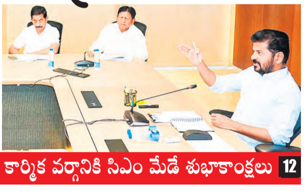
కార్యక వర్గానికి సిఎం మేడే శుభాకాంక్షలు 12

విద్యార్థులకు నాణ్యమైన సామగ్రి ప్రజాపక్షం/ హైదరాబాద్ విద్యార్థులకు అవసరమైన సామగ్రి నరసరావులో జవాబుదారీతనం పెంచేందుకే సెంట్రల్ లైట్స్ ప్రొక్యూర్మెంట్ విధానాన్ని అమలు చేస్తున్నామని, నరసరావుల ప్రయోజనాలు కాపాడేందుకు కాదని ముఖ్యమంత్రి ఎ.రేవంత్ రెడ్డి స్పష్టం చేశారు. దుస్తులు, నోటు పుస్తకాలు, ఇతర సామగ్రి సకాలంలో అందితే విద్యార్థులు చదువుపై పూర్తి స్థాయిలో శ్రద్ధ చూపుతారని, ఇందుకు అన్ని చర్యలు తీసుకోవాలని సిఎం అధికారులను ఆదేశించారు. విద్యా శాఖతో పాటు బీసీ, మైసూరిటీ, గిరిజన సంక్షేమ శాఖలు, ఎస్సీ డెవలప్ మెంట్ శాఖల పరిధిలోని విద్యా సంస్థల్లోని విద్యార్థులకు అందజేసే సామగ్రి సెంట్రల్ లైట్స్ ప్రొక్యూర్మెంట్ పై ముఖ్యమంత్రి ఎ.రేవంత్ రెడ్డి గురువారం సమీక్ష నిర్వహించారు. ఈ సందర్భంగా ముఖ్యమంత్రి రేవంత్ రెడ్డి మాట్లాడుతూ తరువాయి 8లో