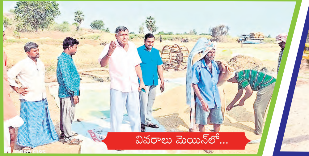
వివరాలు మెయిన్ లో...