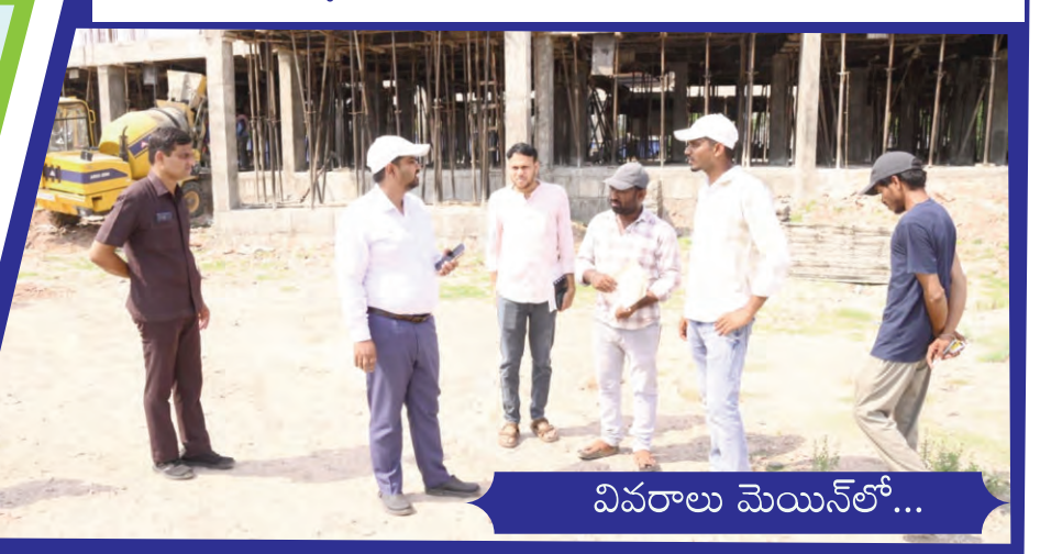
వివరాలు మెయిన్ లో...