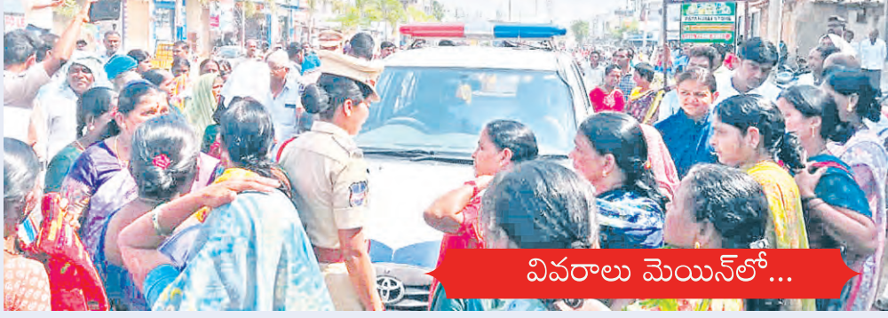
వివరాలు మెయిన్ లో...