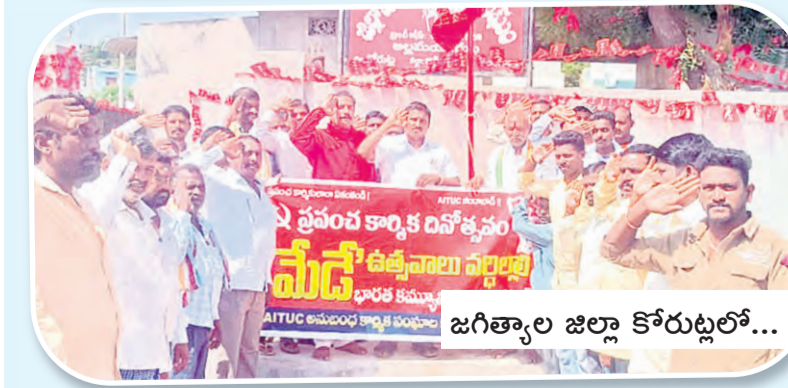
జగిత్యాల జిల్లా కోర్టుల్లో...