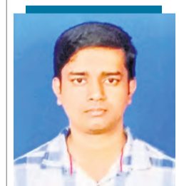
ఎం.కృష్ణ అదిత్య సీనియర్ ఇన్వెస్టింగ్

అమెరికా ప్రాంతం, ప్రపంచం అంతటా ముగిసిన యుద్ధం ముగిసింది. ఇప్పటికే ఇరాన్ పైన అమెరికా ఇజ్రాయెల్ ప్రారంభించిన యుద్ధం దాడికి 60 రోజులు గడిచాయి.