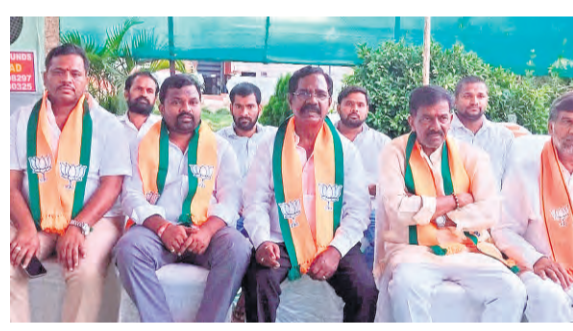
ఘనంగా స్వాగతం పలుకుదాం

ప్రజాపక్షం/బోడుపల్లి: మేడిపల్లి మండలంలో వరుసగా ఇద్దరు తహసీల్దార్లు, నయా తహసీల్దార్లు బదిలీ చేయడం జరిగింది. మొదటి తహసీల్దార్లు, డిప్యూటీ తహసీల్దార్లు బదిలీ చేయడం, ప్రస్తుతం ఇద్దరు తహసీల్దార్లు, డిప్యూటీ తహసీల్దార్లు బదిలీ చేయడం జరిగింది. ప్రస్తుతం ఇద్దరు తహసీల్దార్లు, డిప్యూటీ తహసీల్దార్లు బదిలీ చేయడానికి ప్రయత్నాలు జరుగుతున్నాయని విశ్వసనీయ సమాచారం. ఇలాంటి వరుస బదిలీలు కేవలం పరిపాలన అవసరాలకు కాకుండా, కొన్ని సమస్యలకు భూమి కేసులు, సర్వే సం.33 వంటి రికార్డులపై ఒత్తిడి కోసమేనా అనే అనుమానాలు పెరుగుతున్నాయి. రెవిన్యూ అధికారులు నిబంధనల ప్రకారం పని చేస్తే బదిలీ. ఒత్తిడి కోసమే ప్రకారం బదిలీ బదిలీలన్నీ రాజకీయ నాయకుల కంప్యూటర్లలో జరుగుతున్నాయని స్థానికంగా ఆరోపణలు వినిపిస్తున్నాయి. అనుమానాలు పెరుగుతున్నాయి. రెవిన్యూ అధికారులు నిబంధనల ప్రకారం పని చేస్తే బదిలీ. ఒత్తిడి కోసమే ప్రకారం బదిలీ బదిలీలన్నీ రాజకీయ నాయకుల కంప్యూటర్లలో జరుగుతున్నాయని స్థానికంగా ఆరోపణలు వినిపిస్తున్నాయి. అనుమానాలు పెరుగుతున్నాయి. రెవిన్యూ అధికారులు నిబంధనల ప్రకారం పని చేస్తే బదిలీ. ఒత్తిడి కోసమే ప్రకారం బదిలీ బదిలీలన్నీ రాజకీయ నాయకుల కంప్యూటర్లలో జరుగుతున్నాయని స్థానికంగా ఆరోపణలు వినిపిస్తున్నాయి.