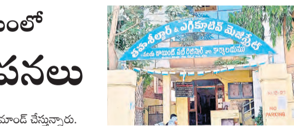
వర్షాలను పెద్ద ఎత్తున ఊహించాలని వినిపిస్తున్నాయి.