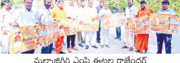
మల్కాజ్గిరి ఎంపి ఈటల రాజేందర్