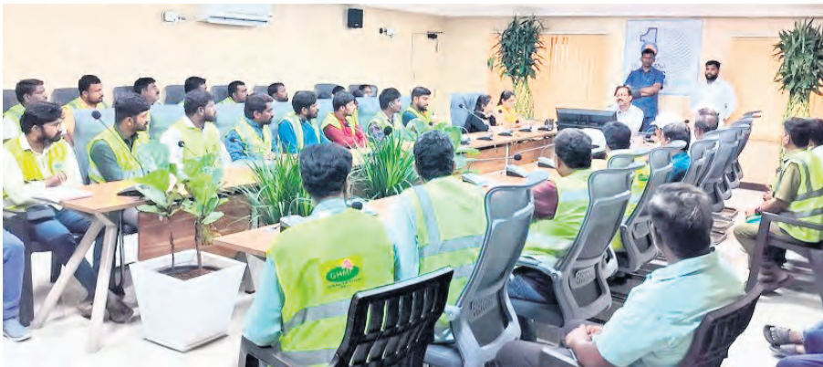
వినయాలు, గైర్జాబు జాబితాలు సమూహ చేయాలని, అన్ని జిబ్బి వెయ్యంట్ల పూర్తి అవగాహన కలిగి ఉండాలని సూచించారు. మరో 20 రోజుల తర్వాత మళ్లీ సమీక్ష సమావేశం నిర్వహిస్తామని తెలిపారు. 99 రోజుల ప్రజాపాలన ప్రగతి ప్రణాళికలో భాగంగా