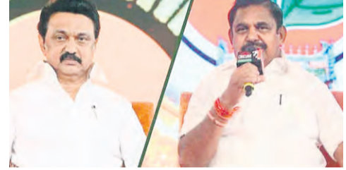
సీఎం పబ్లికం నేతృత్వంలో మిగతా ఎమ్మెల్యేలను మరొక రూపాన్ని ప్రాంతానికి తరలించినట్లు సమాచారం. ప్రభుత్వ ఏర్పాటుపై స్టాలిన్ కు నిర్ణయాధికారం తమిళనాడులో ఒక సుస్థిరమైన ప్రభుత్వం ఏర్పాటుకు అవసరమైన 'అత్యవశ్యకమైన నిర్ణయాలు' తీసుకునేందుకు వీలుగా పార్టీ అధినేత, పదవీకాలం పూర్తిచేసుకుని రాజీనామా చేసేందుకు సిద్ధంగా ఉన్న ముఖ్యమంత్రి ఎం.కె.స్టాలిన్ కు సంబంధ అధికారాలు ఇవ్వడం

చెన్నై: తమిళనాడు రాజకీయ వేడెక్కిన పుళ్ళి 'రిసార్చు రాజకీయాలు' వేడెక్కింది. గత కొద్దిరోజులుగా నెలకొన్న అనిశ్చితికి తెరదించుతూ, ఎఐఎడిఎకె తరఫున ప్రభుత్వాన్ని ఏర్పాటు చేయబోతోందని ఆ పార్టీ సీనియర్ నాయకుడు అన్నాకాంగ్రెస్ డిమా వ్యక్తం చేశారు. రాష్ట్రంలో ఎవరూ ఊహించని విధంగా ఒక 'అద్భుతం' జరగబోతోందని ఆయన వ్యాఖ్యానించడం ఇప్పుడు రాజకీయ వర్గాల్లో చర్చనీయాంశమైంది. అదే విధంగా ఈనెల 10వ తేదీ వరకు తమ ఎమ్మెల్యేలు ఎవరూ కూడా రాష్ట్రాన్ని వదిలి వెళ్లవద్దని, పార్టీ ఎలాంటి నిర్ణయం తీసుకున్నా దానికి కట్టుబడి ఉండాలని డిఎంకె అధినేత ఎంకె స్టాలిన్ కొత్తగా పనిని తెలియజేశారు. దీంతో రాష్ట్రంలో ప్రవిడ పార్టీలు ఒక్కటవుతున్నాయో అనే చర్చ వినిపిస్తోంది. ఇప్పటికే ప్రభుత్వ ఏర్పాటు దిశగా పావులు కదుపుతున్న ఎఐఎడిఎకె తమ ఎమ్మెల్యేలు చేజారిపోకుండా జాగ్రత్తలు తీసుకుంటుంది. సీనియర్ నేతల పర్యవేక్షణలో సుమారు 27 మంది ఎమ్మెల్యేలు పుదుచ్చేరిలోని ఒక ప్రైవేట్ రిసార్చుకు చేరుకోగా,