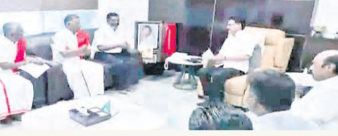
నేతృత్వం వహిస్తున్న డి.వి.కె. పార్టీలు

● విసికె, వామపక్షాల ప్రకటన ● డిఎంకె అధినేత స్టాలిన్ కే భేటీ చెన్నై: ప్రభుత్వం ఏర్పాటు చేసేందుకు సహకరించి మద్దతు ఇవ్వాలని టి.వి.కె నాయకుడు విజయ్ వామపక్షాలకు చేసిన విజ్ఞప్తిపై మధ్య సి.పి.ఐ., సి.పి.ఐ(ఎం), వి.సి.కె పార్టీల నాయకులు గురువారం డి.ఎంకె అధినేత, పదవీకాలం పూర్తిచేసుకుని రాజీనామా చేస్తున్న ముఖ్యమంత్రి ఎం.కె.స్టాలిన్ కు సమా