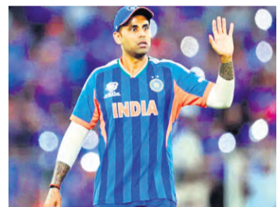
బ్యాటింగ్ పుష్కల పనిచేస్తుంది లేదు. సూర్య రాజేం చలేక పోతున్నాడని అలోపబలు వస్తున్నాయి. సెలెక్షన్ కమిటీ బీబీ కె.ఆర్ అగార్ కర్కర్ కూడా సూర్య విషయంలో సమాచారం కోల్పోయినట్లు తెలుస్తోంది. ఫామ్ లో తీసి సూర్య స్థానంలో శ్రేయాస్ ను కెప్టెన్ గా దింపాలని భావిస్తున్నారు. మరీ పేలవంగా ఆడుతున్న సూర్య టీమిండియా

ముంబై: టీమిండియా టి-20 జట్టులో భారీ మార్పులు జరిగి అవకాశాలు ఉన్నాయి. ఇండియాకు 2026 టి-20 వరల్డ్ కప్ ను సూర్యకుమార్ అండంచిన విషయం తెలిసింది. అయితే అతన్ని సారథ్యం నుంచి తప్పించాలని బిసినెస్ పర్సన్లు భావిస్తున్నట్లు తెలుస్తోంది. అజిత్ అగార్ కర్కర్ నేతృత్వంలోని సెలెక్షన్ కమిటీ.. కొత్త కెప్టెన్ ఎంపిక చేసే అవకాశాలు ఉన్నాయి. టిమిండియా టి-20 కెప్టెన్ గా శ్రేయాస్ అయ్యారేకు ఛాన్స్ ఇవ్వాలని బిసినెస్ పర్సన్లు భావిస్తున్నట్లు సమాచారం. ఈ యేటి ఐపిఎల్ సీజన్లో పంజాబ్ కింగ్స్ కెప్టెన్ గా శ్రేయాస్ అయ్యారే ఇరగడిస్తున్నాడు. రాబోయే సీజన్లో కెప్టెన్ గా పాటు యువ అటాకలకు కూడా అవకాశం ఇవ్వాలని బిసినెస్ భావిస్తున్నది. బియాండే, ఇంగ్లండ్ లాంటి వైశ్ జట్టులో యువతలో టోటల్ డబ్బు కాన్సు ఉన్నది. ఇటీవల సూర్యకుమార్ యాదవ్ తన