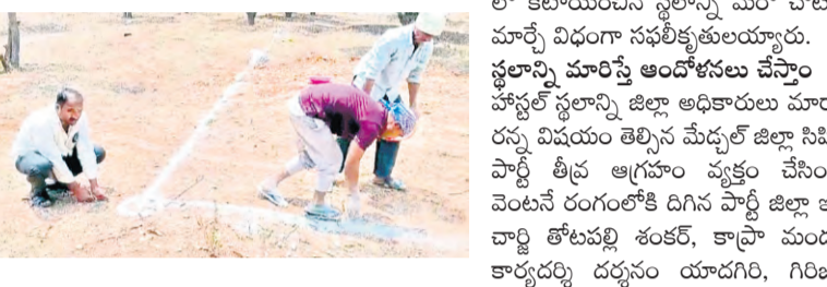
స్థలాన్ని చదును చేసి నిర్మాణ పనులు ప్రారంభించేందుకు ముగ్గు వేసి తయారయ్యారు. ఈ సమయంలోనే జిల్లా ఉన్నతాధికారుల నుండి హాస్టల్ భవనానికి సర్వే నంబరు 647 కాకుండా 646కి మారుస్తున్నామని, పనులు ఆపేయాలని మరోసారి ఆడికాలు రావటంతో పనులు నిలిచిపోయాయి.

తెర వెనుక ఖాగోతమిడి... జవహర్ నగర్ ప్రాంతంలో ఇటీవలి కాలంగా రియల్ ఎస్టేట్ ధరలు పెరిగి భూమిలకు రెక్కలు వచ్చాయి. ఇదే అదనంగా ప్రభుత్వ మహిళా శిశు సంక్షేమ అధికారులకు ఉత్తర్వులు జారీ