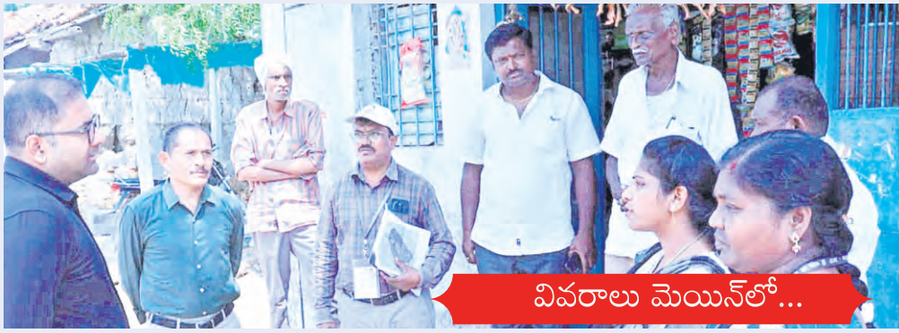
వివరాలు మెయిన్ లో...