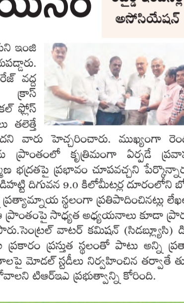
ప్రభుత్వాన్ని కోరిన తెలంగాణ రిటైర్డ్ ఇంజనీర్ల అసోసియేషన్