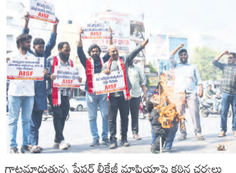
గాలమాడుతున్న ఫిబ్రవరి లికేజీ మాఫియాపై కఠిన చర్యలు