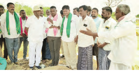
మాజీమంత్రి కొప్పుల ఈశ్వర్

ప్రజాపక్షం/ధర్మపురి : ధాన్యం కొనుగోలు కేంద్రాలలో ముందస్తు ఏర్పాట్లు చేయకుండా రైతులు తీసుకువచ్చిన ధాన్యం 15 రోజులైనా కొనుగోలు జరుపకపోవడం పట్ల మాజీమంత్రి కొప్పుల ఈశ్వర్ ప్రభుత్వం పై ఆగ్రహం వ్యక్తం చేశారు. జగిత్యాల జిల్లా ధర్మపురి మండలం దొంతాపూర్, మగ్గిడి గ్రామాలలో ఏర్పాటు చేసిన వరి, మక్కా, జొన్న కేంద్రాలను బుధవారం ఈశ్వర్ పరిశీలించారు. కొనుగోలు లో జాప్యం, అవసరమైనన్ని గన్నీ సంచులు అందుబాటులో లేకపోవడం పట్ల జిల్లా కలెక్టర్ తో ఫోన్లో మాట్లాడారు. ధాన్యం విక్రయానికి వచ్చిన రైతులు రాజులు పోసు