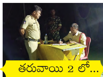
తరువాయి 2 లో...

ప్రజాపక్షం /సిర్పూర్-టి : సిర్పూర్ టి మండల పరిధిలో పశువుల రవాణా పేరుతో జరుగుతున్న అక్రమ వ్యాపారం పై తీవ్ర ఆరోపణలు వినిపిస్తున్నాయి. రవాణా వాహనాలలో పశువులకు కనీస పరిరక్షణ లేకుండానే వందల సంఖ్యలో తరలింపులు జరుగుతున్నాయని స్థానికులు ఆవేదన వ్యక్తం చేస్తున్నారు. పచ్చిగడ్డి, తాగునీరు వంటి ప్రాథ