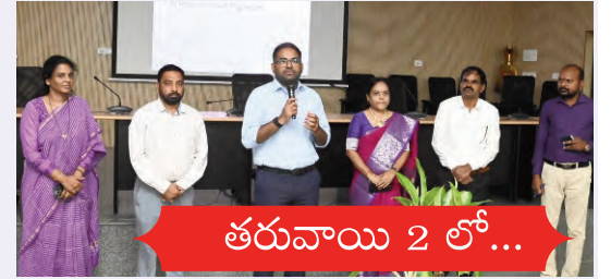
తరువాయి 2 లో...

ప్రజాపక్షం/పెద్దపల్లి : ప్రభుత్వ పాఠశాలలో జరుగుతున్న అభివృద్ధి, అందిస్తున్న నాణ్యమైన విద్య ఫలాలు 100 శాతం ప్రజలకు చేరాలి స్థానిక ప్రజాప్రతినిధులు కృషి చేయాలని జిల్లా కలెక్టర్ కోయ శ్రీ హర్ష కోరారు. 99 రోజుల ప్రజాపాలన ప్రగతి ప్రాణాలకు కార్యక్రమంలో భాగంగా నిర్వహిస్తున్న విద్యా శాఖకు సంబంధించిన కార్యక్రమాలు పై సర్పంచులు, కార్పొరేటర్లు, మున్సిపల్ కౌన్సిలర్లతో బుధవారం సమీకృత జిల్లా కలెక్టరేట్ లోని సమావేశ మందిరంలో సమావేశం నిర్వహించారు. ఈ సందర్భంగా మాట్లాడుతూ గత రెండేళ్లుగా ప్రభుత్వ పాఠశాలల్లో మౌలిక వసతులు అభి