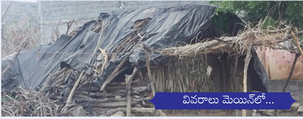
వివరాలు మెయిన్ లో...