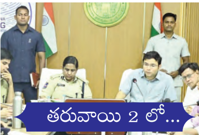
తరువాయి 2 లో...