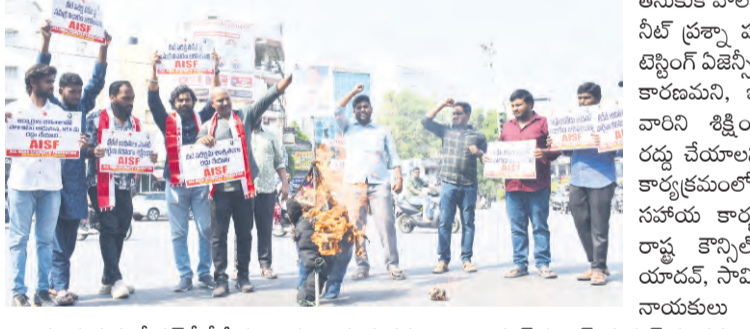
గాలమాడుతున్న పేపర్ లిటికేటి మాఫియాపై కఠిన చర్యలు