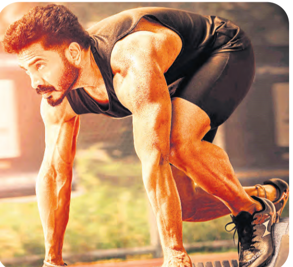
కెమెరామెన్ విశ్వనాథ్ డీపెన్ టిక్, ఎడిటర్ దినేశ్ కుమార్, ఆర్ట్ డైరెక్టర్ రాము తంగూజ్, కొరియోగ్రఫీ డర్శిష్, ఎగ్జిక్యూటివ్ ప్రొడ్యూసర్ సుధాకర్ తిలకినేని.

సాంకేతికత కోర్కే డ్రామాగా గంగా ఎంటర్టైన్మెంట్స్, సృష్టిక్ విజన్స్ సంయుక్త నిర్మాణంలో కేజీఆర్ హీరోగా ఎన్టీ ప్రకాశ్, అజిత్ బాస్కర్, అదర్జి మురుగిన్ నిర్మించిన చిత్రం 'గుర్తింపు'. ఈ మూవీకి జి.పి. తెన్ పతియన్ దర్శకత్వం వహించారు. దేశంలోని క్రీడా వ్యవస్థ, రాజకీయ వ్యవస్థ, ప్రభుత్వ పనితీరు, పేదల క్రీడలకు ఎంత దూరంలో ఉన్నారో అనే విషయాల్ని ఇతివృత్తంగా తీసుకుని 'గుర్తింపు' సినిమాని తెరకెక్కుచున్నారు. తాజాగా ఈ సినిమాకి సంబంధించిన ట్రైలర్ను రిలీజ్ చేశారు. 'క్రీకెట్ నేషనల్ గేమ్'.. 'హాకీ మన నేషనల్ గేమ్'.. 'మన దేశానికి నేషనల్ గేమ్ అనేదే లేదు. దురదృష్టవశాత్తూ మాన్ పది సెకన్లు కాదు సార్ నా జీవితం. వారి వెనకాల నా 29 ఏళ్ల జీవితం, శ్రమ ఉంది సర్.. మీట్రి వెళ్లి గెలుస్తాం.. కానీ అక్కడి వరకే వెళ్లేకపోతున్నాం. మన లాంటి వాళ్లకి గేమ్ మామూలు విషయం కాదు అదే మనకు విడుదల, 'స్పోర్ట్స్ అని కొడితే క్రీకెట్ గురించి మాత్రమే స్టూన్ వస్తుంది', 'దేశం కోసం పోరాడే వాళ్లకి మాత్రమే కాదు.. క్రీడాకారులకే కూడా ఎంతో బలపడి ఉంటుంది. ఈ ట్రైలర్ గమనిస్తే ఓ పేదవాడు అద్భుతంగా ఎదిగి క్రమంలో ఎలాంటి పరిస్థితుల్ని ఎదుర్కొన్నాడు.. ఈ ప్రయాణంలో క్రీడా శాఖ పంపిణీ కోర్సు మెట్లు ఎందుకు ఎక్కిందా.. అసలు అతనికి ప్రభుత్వం నుంచి ఎలాంటి సమస్యలు వచ్చాయి.. కోర్టు కోరుకున్న న్యాయం దక్కిందా? లేదా? అనే ఉత్సాహక కలిగించేలా ట్రైలర్ను కట్ చేశారు. విజయ్ లాల్, సాంకేతిక పరంగా ట్రైలర్ అదిరిపోయింది. హీరోగా కేజీఆర్ లక్ష్మీ, బాడి (ట్రాన్స్) ర్విష్వత్, హర్షావెన్స్ ఈ ట్రైలర్ అదిరిపోయింది. ఈ మూవీని జూన్లో విడుదల చేసేందుకు చిత్రయూనిట్ సన్నాహాలు చేస్తోంది. ఈ చిత్రానికి సంగీతం గి.అమర్ వైబ్రేట్, యాక్షన్ పీటర్ హాయిస్,