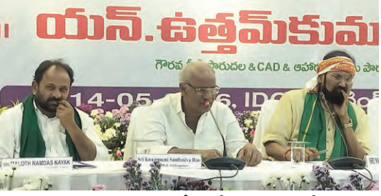
తక్షణ తరలింపుకు చర్యలు తీసుకోండి : కూసనేని

ద్వారా ధాన్యాన్ని కొనుగోలు చేస్తున్నామని ఈ ఏడాది యాసంగిలో 65 లక్షల ఎకరాల్లో వరి సాగు చేయగా 140 లక్షల మెట్రిక్ టన్నుల దిగుబడి వచ్చినట్లు ఆయన తెలిపారు. ఇందులో 90 లక్షల మెట్రిక్ టన్నుల ధాన్యం కొనుగోలు లక్ష్యంగా ప్రభుత్వం ముందుకు సాగుతుందన్నారు. ధాన్యం కొనుగోలు కోసం రూ. 22వేల కోట్లు ప్రభుత్వం సిద్ధం చేసిందని ఇప్పటి వరకు 30 లక్షల మెట్రిక్ టన్నుల ధాన్యాన్ని కొనుగోలు చేశామన్నారు. ప్రతి యేటా ధాన్యం కొనుగోలుకు రూ. 45వేల కోట్లు కేటాయించినట్లు ఆయన తెలిపారు. రాష్ట్రంలో వ్యవసాయ ఉత్పత్తులను నిల్వ చేసేందుకు గోడ్డాన్ల సామర్థ్యం చాలా తక్కువగా ఉందని గోడ్డాన్ల సామర్థ్యాన్ని పెంచేందుకు కృషి చేస్తున్నామని మంత్రి తెలిపారు. తాలు, తరుగు పేరుతో ఇబ్బందులు పెడుతున్న మిల్లర్లపై చర్యలు తీసుకోవాలన్నారు. వాహనాల యజమానులు రైతుల వద్ద నుండి అదనపు వసూళ్లు చేస్తే పోలీసులు చర్యలు తీసుకోవాలని సూచించారు. కేంద్ర ప్రభుత్వం కూడా ధాన్యం కొనుగోలు విషయంలో కొంత ఇబ్బంది పెడుతుందని మద్దతు ధర ప్రకటిస్తుంది కానీ సూటికి సూరు శాతం కొనుగోలు చేయడంలో విఫలమవుతుందన్నారు. మంత్రి పొంగులేటి శ్రీనివాసరెడ్డి మాట్లాడుతూ రైతుల సంక్షేమం కోసం కొంత ఖర్చును భరించేందుకైనా ప్రభుత్వం సిద్ధంగా ఉందన్నారు. ప్రభుత్వం బోనస్ ప్రకటించడం వల్లే వరి సాగు గణనీయంగా పెరిగిందని ఆయన తెలిపారు. ఇదిలా ఉండగా మొక్కజొన్న కొనుగోలుకు సంబంధించి విలేకరులు అడిగిన ప్రశ్నకు మంత్రి స్పందించ లేదు.