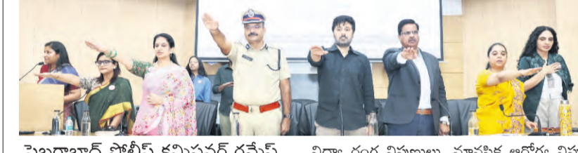
విద్యార్థులకు అవగాహన కల్పిస్తూ, ఒంటరితనం, వ్యసనాలపై అవగాహన కల్పించాలని సూచించారు. పశువుల అక్రమ రవాణాకు నిషేధం ఉందని, వేద్యులు చేపట్టాలని ఆదేశించారు.