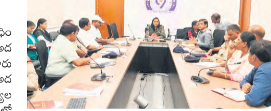
పై ప్రజలకు అవగాహన కల్పిస్తూ, ఎక్కడ కూడా గోవులు, ఒంటిలను వధించకుండా చర్యలు చేపట్టాలని ఆదేశించారు. పశువులను తరలించడానికి తప్పనిసరిగా పశు వైద్యాధికారిచే ప్రమీకరణ పొందాలన్నారు.