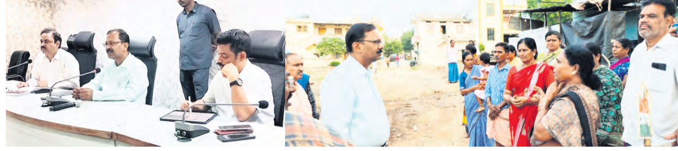
దమ్మాయిగూడ ప్రాంతాల్లో జరుగుతున్న జనగణన కార్యక్రమాలను సమీక్షించి, ఎన్.హెచ్.ఎం సిబ్బంది హాజరు, ఫీల్డ్ డ్యూటీలపై అధికారులను ప్రశ్నించారు. జనగణన కార్యక్రమాల సజావుగా సాగేందుకు పర్యవేక్షణ మరింత కట్టడికొరకు చేయాలని ఆదేశించారు.