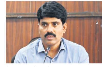
ప్రజాపక్షం/రంగారెడ్డి: కొనుగోలు చేసిన ధాన్యాన్ని కేటాయించిన ప్రకారంగా రైస్ మిల్లులకు, గోదాములకు తరలించాలని, సంబంధిత రైస్ మిల్లులు, అధికారులు తరలించిన ధాన్యాన్ని త్వరగా దిగుమతి అయ్యేలా చర్యలు తీసుకోవాలని తెలిపారు.

ప్రజాపక్షం/రంగారెడ్డి: కొనుగోలు చేసిన ధాన్యాన్ని కేటాయించిన ప్రకారంగా రైస్ మిల్లులకు, గోదాములకు తరలించాలని, సంబంధిత రైస్ మిల్లులు, అధికారులు తరలించిన ధాన్యాన్ని త్వరగా దిగుమతి అయ్యేలా చర్యలు తీసుకోవాలని తెలిపారు. అవసరం మేరకు హామాలను సంఖ్య పెంపొందించుకోవాలని సూచించారు. ధాన్యం తరలింపుకు అవసరమైన లాల్లెలను సమకూర్చుకోవాలని, రైస్ మిల్లుల యజమానులకు ధాన్యం దిగుమతి ప్రక్రియ వేగవంతంగా చేపట్టాలని కోరారు. కొనుగోలు కేంద్రాలలో రైతులకు అవసరమైన వసతులు కల్పించాలని, గన్ను బ్యాగ్ లు అందుబాటులో ఉండేలా చూడాలన్నారు. రైతులకు ఇబ్బందులు కలగకుండా కొనుగోలు ప్రక్రియను సమర్థవంతంగా నిర్వహించాలని సూచించారు. కొనుగోలు కేంద్రాలలో అవసరమైన గన్ను బ్యాగ్ లు, ట్రాక్టర్ లను అందుబాటులో ఉండే విధంగా చర్యలు చేపట్టాలని స్పష్టం చేశారు. కొనుగోలు చేసిన ధాన్యాన్ని అలస్యం లేకుండా కాంటా వేసి మిల్లులకు తరలించే చర్యలు చేపట్టాలని సూచించారు. రైతులు తమ పంటను విక్రయించే సమయంలో ఎలాంటి ఇబ్బందులు ఎదురకాకుండా అవసరమైన అన్ని సౌకర్యాలు కొనుగోలు కేంద్రాల్లో అందుబాటులో ఉంచాలని తెలిపారు. తమ శాతం, నాణ్యత ప్రమాణాల పరిశీలనలో పాఠశాలను పెంపొందించాలని సూచించారు. ట్యాంక్ ఎంట్రిలను వేగవంతం చేయాలని సంబంధిత అధికారులకు ఆదేశించారు.