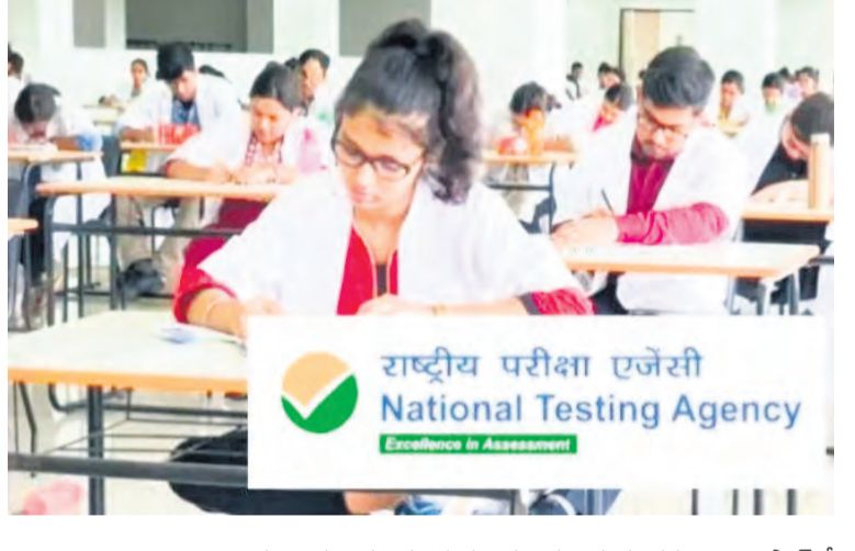
राष्ट्रीय परीक्षा एजेंसी National Testing Agency

విజయం సాధించింది. నరేంద్ర మోడీ '3డి వ్యాపార మాత్రం' ఇవే: 1. 1డి: విద్యార్థులు గత పరీక్షలలో సరిగ్గా రాజీంపకపోయినా, ఆర్థిక పెట్టుబడితో సీడీవీ ఖరీదైన కేరింగ్ ద్వారా వారు మెరుగుపడే అవకాశం. 2. 2డి: సరస్వతి శిశు విద్యా మందిరాలకు, బిజెపి నాయకులకు వారు కొరం ట్యూబు డబ్బు చెల్లించడం ద్వారా, కానీ ఎంఎంబిఐఐఐ అవకాశం ఉన్న పరీక్షా కేంద్రాలలో విద్యార్థులు పరీక్ష రాసేందుకు ఏర్పాటు చేయవచ్చని ఆరోపణ. 3. 3డి: బిజెపి నాయకుల ద్వారా విద్యార్థులు ముందుగానే ప్రశ్నపత్రాలను కొనుగోలు చేసి, జవాబులను పరీక్షల