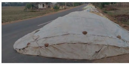
గించేలా చర్యలు తీసుకోవాలని, ప్రయాణం సురక్షితంగా సాగేలా చూడాలని వాహనదారులు డిమాండ్ చేస్తున్నారు.

స్థలం లేకపోవడంతో వాహనదారులు తీవ్ర ఇబ్బందులు పడుతున్నారు. ముఖ్యంగా రాత్రి వేళల్లో ఈ ధాన్యపు కుప్పలు సరిగ్గా కనిపించకపోవడంతో పెద్ద ప్రమాదాలు పొంచి ఉన్నాయని స్థానికులు, ప్రయాణికులు తీవ్ర ఆందోళన వ్యక్తం చేస్తున్నారు. రహదారిపై ధాన్యపు కుప్పల వల్ల ప్రమాదం జరిగి ఏదైనా ప్రాణ నష్టం సంభవిస్తే దానికి బాధ్యులు ఎవరు? అని వాహనదారులు, ప్రయాణికులు అధికారులను నిలదీస్తున్నారు. ఇప్పటికైనా సంబంధిత అధికారులు తక్షణమే స్పందించి, రహదారిపై ఉన్న ధాన్యం కుప్పలను తొల