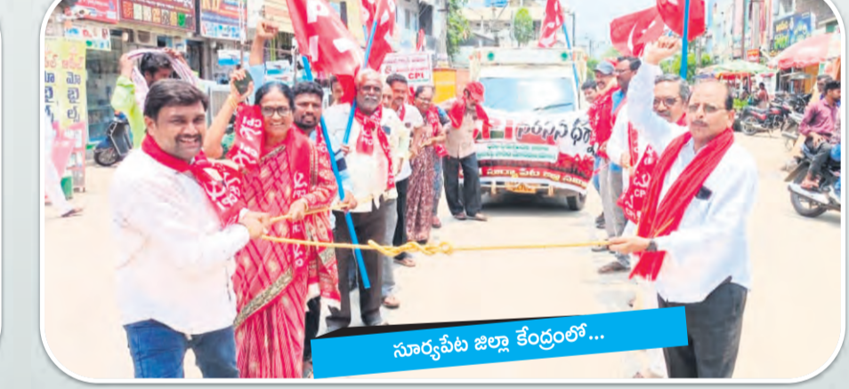
సూర్యపేట జిల్లా కేంద్రంలో...