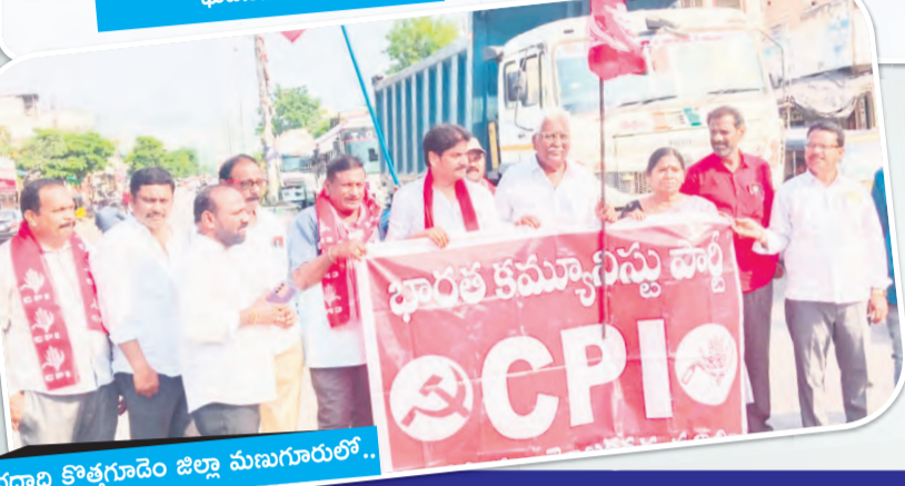
భద్రాద్రి కొత్తగూడెం జిల్లా మునుగూరులో..