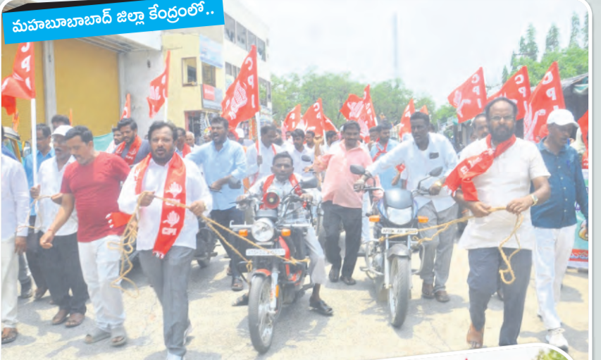
మహాబూబాబాద్ జిల్లా కేంద్రంలో..