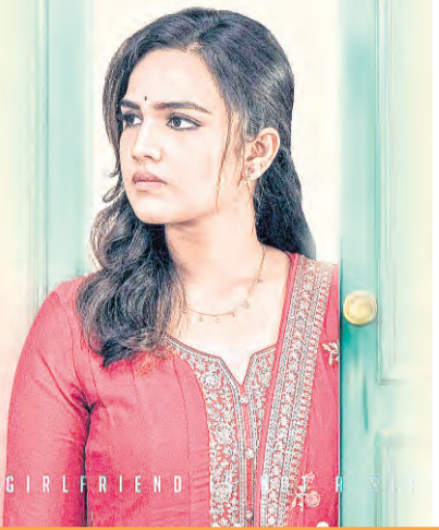
జొన్నపిత్తుల దర్శకత్వంలో 'లలిత'