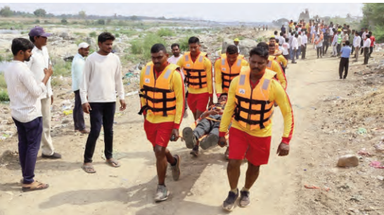
-అత్యవసర పరిస్థితుల్లో ముఖ్యమైన పత్రాలను భద్రపర్చుకోవాలి -విజయవంతంగా ప్లడ్ మాక్ ఎక్స్పర్ట్ -మాక్ డ్రీల్ను పరిశీలించిన కలెక్టర్