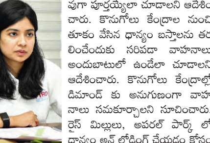
వుగా పూర్తయ్యేలా చూడాలని ఆదేశించారు. కొనుగోలు కేంద్రాల నుంచి తూకం వేసిన ధాన్యం బస్తాలను తరలించేందుకు సరిపడా వాహనాలు అందుబాటులో ఉండేలా చూడాలని ఆదేశించారు. కొనుగోలు కేంద్రాల్లో డిమాండ్ కు అనుగుణంగా వాహనాలు సమకూర్చాలని సూచించారు. రైస్ మిల్లులు, అవరల్ పార్క్ లో ధాన్యం అన్ లోడింగ్ చేయడం కోసం హామాలీల కొరత లేకుండా చూడాలని, డిమాండ్ కు అనుగుణంగా పెంచి, ఇబ్బందులు కలగకుండా పర్యవేక్షణ చేయాలని స్పష్టం చేశారు. హామాలీలకు భోజనం, వైద్య సేవలు అన్ని సౌకర్యాలు కల్పించాలని సూచించారు. కొనుగోలు కేంద్రాలు, మిల్లుల వద్ద కేటాయించిన రెవెన్యూ, ఇతర శాఖల సిబ్బంది సమన్వయం చేసుకుని విధులు నిర్వహించాలని, క్షేత్ర స్థాయిలో ఏమైనా సమస్యలు తలెత్తితే వెంటనే జిల్లా యంత్రాంగం దృష్టికి తీసుకురావాలని జిల్లా కలెక్టర్ ఆదేశించారు.

ప్రజాపక్షం/రాజన్న సిరిసిల్ల : కొనుగోలు కేంద్రాల్లో ధాన్యానికి అనుగుణంగా లారీల సంఖ్య పెంచాలని జిల్లా కలెక్టర్ గిరిమ అగ్రవాల ఆదేశించారు. ధాన్యం కొనుగోళ్ల ప్రక్రియ వేగవంతం, వాహనాల ద్వారా ధాన్యం తరలింపు, హామాలీల సంఖ్య పెంపు, అన్ లోడింగ్ చేయడం, రైతులకు ఇబ్బందులు కలగకుండా తీసుకోవాల్సిన చర్యలు, తదితర అంశాలపై సోమవారం అదనపు కలెక్టర్ గడ్డం నగేష్ తో కలిసి పౌర సహాయక, సహకార శాఖ, గ్రామీణాభివృద్ధి శాఖ, రవాణా, మెయింట్ అధికారులతో కలిసి జిల్లా కలెక్టర్ టిలీ కాన్ఫరెన్స్ ద్వారా సమీక్షించారు. ప్రతి రోజు ఉదయం 08.00 గంటలకు జిల్లా కలెక్టర్ అధికారులతో టిలీ కాన్ఫరెన్స్ ద్వారా సమీక్ష నిర్వహిస్తున్నారు. జిల్లాలోని కొనుగోలు కేంద్రాల్లో ఉన్న ధాన్యం తూకం వేయడం, తూకం వేసిన ధాన్యాన్ని మిల్లులకు, గోదాములకు తరలించడంపై అధికారులు దృష్టి సారించి, క్షేత్ర స్థాయిలో అప్రమత్తంగా ఉండాలని, కొనుగోళ్ల ప్రక్రియ సజా