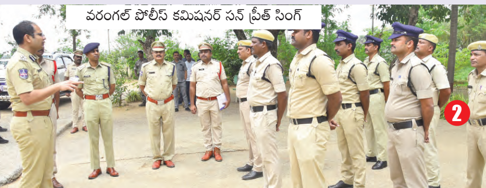
వరంగల్ పోలీస్ కమిషనర్ సన్ ప్రీత్ సింగ్