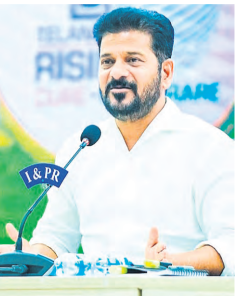
పెంచిన కనీస వేతనాల వివరాలు

ప్రజాపక్షం/హైదరాబాద్ రాష్ట్రంలోని కార్మికులకు కనీస వేతనాలను పెంచుతున్నట్లు ముఖ్య మంత్రి ఎ.రేవంత్ రెడ్డి ప్రకటించారు. పెంచిన వేతనాలు జూన్ 1వ తేదీ నుంచి అమలులోకి వస్తాయని చెప్పారు. రాష్ట్రాన్ని మూడు జోన్లుగా, కార్మికులను నాలుగు కేటగిరీలుగా విభజించి కనీస వేతనాలను పెంచామని వెల్లడించారు. ఆన్ స్ట్రెట్ కార్మికులకు కేటగిరీలో జోన్ -1లో రూ.16,000 లకు, జోన్-2లో రూ.15,000లకు, జోన్-3లో రూ.14,000లకు, సెమీ స్ట్రెట్ కార్మికులకు కేటగిరీలో జోన్ -1లో రూ.17,000 లకు, జోన్-2లో రూ.16,000లకు, జోన్-3లో రూ.15,000లకు, స్ట్రెట్ కేటగిరీలో జోన్ -1లో రూ.18,500లకు, జోన్-2లో రూ.17,500లకు, జోన్-3లో రూ.16,500లకు, హైలీ స్ట్రెట్ కేటగిరీలో జోన్ -1లో రూ.20,000లకు, జోన్-2లో రూ.19,000 లకు, జోన్-3 లో రూ.18,000 లకు పెంచుతున్నట్లు సీఎం రేవంత్ రెడ్డి వివరించారు. గత బిఆర్ఎస్ ప్రభుత్వ హయాంలో కార్మికుల కనీస వేతనాలు నిర్ణయించకపోవడంతో 1.11 కోట్ల మంది కార్మికులు నష్టపోయారని విమర్శించారు. తెలంగాణ రాష్ట్ర ఆవిర్భావం తర్వాత కార్మికుల వేతనాల సవరణను మొట్టమొదటి సారి కాంగ్రెస్ ప్రభుత్వమే చేసిందని చెప్పారు. హైదరాబాద్ లోని దాక్టర్ బి.ఆర్. అంబేద్కర్ సచివాలయంలో గురువారం జరిగిన మీడియా సమావేశంలో సీఎం మాట్లాడారు. సమావేశంలో కార్మికులకు శాఖ మంత్రి గద్దం వివేక్ వెంకటస్వామి, ప్రభుత్వ విప్ వేముల వీరేశం, విజయరమణారావు, ప్రభుత్వ నలువదారు తరువాతి 8లో