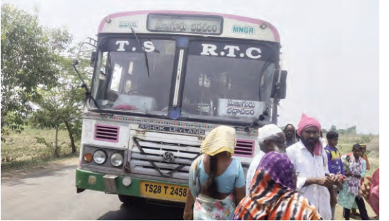
విచారస్తున్నట్లు తెలిపారు. ప్రాథమిక విచారణలో డ్రైవర్ అధిక మోతాదులో మద్యం సేవించినట్లు గుర్తించినట్లు పోలీసులు వెల్లడించారు. ఈ ఘటనతో ప్రధాన రహదారిపై కొంతసేపు ట్రాఫిక్ కు అంతరాయం ఏర్పడి వాహనాలు భారీగా నిలిచిపోయాయి.

ప్రజాపక్షం/అశ్వపురం: మండలంలోని మొండికుంట వద్ద మణు గూరు, కొత్తగూడెం ప్రధాన రహదారిపై సోమవారం భారీ రోడ్డు ప్రమాదం త్వరిత తప్పింది. బిజీ కొత్తూరు, మొండికుంట వద్ద కట్టు కాలన సమీపంలో మణుగూరు నుంచి భద్రాచలం వైపు వెళ్తున్న పల్లె వెలుగు బస్సును వెనుక నుంచి ఓ లారీ ఢీ కొట్టింది. ప్రత్యక్ష నోక్కుల కఠనం ప్రకారం లారీ డ్రైవర్ మధ్యం మత్తులో నిర్లక్ష్యంగా వాహనం నడపడం వల్ల ప్రమాదం జరిగినట్లు తెలుస్తోంది. అదే సమయంలో రోడ్డుపై విద్యుత్ స్తంభాలు తీసుకెళ్తున్న ట్రాక్టర్ కు కూడా లారీ ఢీ కొట్టే ప్రమాదం దృటిలో తప్పడంతో అక్కడ ఒక్కసారిగా ఉద్రిక్త పరిస్థితులు నెలకొన్నాయి. ప్రమాద సమయంలో బస్సులో పెద్ద సంఖ్యలో ప్రయాణికులు ఉండగా, ఢీ కొన్న ప్రభావంతో కొంత మందికి స్వల్ప గాయాలయ్యాయి. స్థానికులు వెంటనే స్పందించి సహాయక చర్యలు చేపట్టి ప్రయాణికులను సురక్షితంగా బయటకు తీసుకొచ్చారు. సమాచారం అందుకున్న అశ్వపురం పోలీసులు సంఘటనా స్థలానికి చేరుకుని పరిస్థితిని అదుపులోకి తీసుకున్నారు. లారీ డ్రైవర్ ను అదుపులోకి తీసుకుని గంగాదేవి గుట్టను కాపాడాలంటూ తహసీల్దార్ కు గ్రామస్తులు వినతి