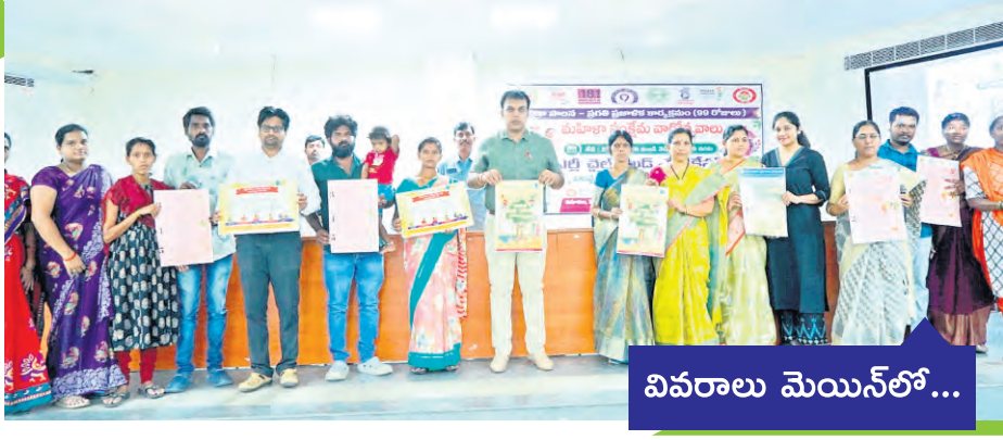
వివరాలు మెయిన్ లో...