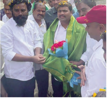
కొవడానికి అధిక మద్దతు ధర కల్పించారని పేర్కొన్నారు. క్వింటాలుకు రూ.2400 మద్దతు ధరతో చొప్పదండి, రామదుగు, గంగాధర మండలాల రైతులకు ఎంతో లాభం చేకూరిందని మక్కల కొనుగోలుతో లారీల కొరత ఉండడంతో ఎమ్మెల్యే స్వయంగా పై అధికారులతో మాట్లాడి వర్షం వస్తే రైతుల పంట తడిసిపోకుండా పంట నిల్వ ఉంచడానికి 2 గోదాములను యుద్ధప్రతిపదికన ఏర్పాటు చేసి నిజమైన రైతు బాంధవుడిగా నిలిచారని అన్నారు. రైతు కుటుంబంలో పుట్టిన బిడ్డాకు రైతు కష్టం తెలుసని వారి కోసం పని చేయడం తృప్తిగా ఉన్నట్లు ఎమ్మెల్యే మేడిపల్లి సత్యం పేర్కొన్నట్లు మార్కెట్ చైర్మన్ తెలిపారు.

ప్రజాపక్షం/చొప్పదండి : చొప్పదండి ఎమ్మెల్యే, కరీంనగర్ జిల్లా కాంగ్రెస్ పార్టీ అధ్యక్షుడు మేడిపల్లి సత్యం రైతుల కోసం అహర్నిశలు కృషి చేస్తున్నారని రైతుల కష్టం తీర్చడమే ధ్యేయంగా ప్రత్యేక శ్రద్ధతో పని చేస్తున్నారని దానికి నిదర్శనమే చొప్పదండి వ్యవసాయ మార్కెట్ రాష్ట్రంలోనే అత్యధిక మక్కల కొనుగోలు కేంద్రంగా నిలిచిందని వ్యవసాయ మార్కెట్ చైర్మన్ కొత్తూరి మహేశ్ కొనియాడారు. రాష్ట్రం మొత్తం మీద 3 కేంద్రాలకు మాత్రమే అనుమతి ఉంటే చొప్పదండి కేంద్రానికి ప్రత్యేకంగా అనుమతి ఇప్పించి తాను ఇచ్చిన హామీని నిలబెట్టుకున్న ఎమ్మెల్యే మేడిపల్లి సత్యం నిబద్ధతకు రైతులు సాక్ష్యమని అన్నారు. నియోజకవర్గంలోని ప్రతి గింజ ప్రభుత్వమే కొనుగోలు చేసేలా రాతింభవళ్లు అధికారులతో సమీక్షలు నిర్వహిస్తూ రైతులకు ఒక్క పైసా కూడా సస్టం రాకూడదని ప్రత్యేక దృష్టి సారించారని అన్నారు. రైతుల అభ్యుద్ధన మేరకు మక్కల కొనుగోలు కేంద్రాన్ని వారం రోజులలో ఏర్పాటు చేస్తానని ఇచ్చిన హామీని కేవలం 24 గంటల్లోనే అమలు చేసి చూపారని అన్నారు. చొప్పదండికి మక్కల కొనుగోలు కేంద్రాన్ని కేటాయించడం రైతుల పట్ల ఎమ్మెల్యేకి ఉన్న అంతిమభావాన్ని, చిత్తశుద్ధిని చాటిచెబుతుందన్నారు. ఇప్పటికే చొప్పదండి మార్కెట్లో 50 వేల క్వింటాళ్ల మొక్కజొన్న ధాన్యం కొనుగోలు చేసి రికార్డు సృష్టించారని తెలిపారు. మండలంలోని రైతులకు మొక్కజొన్న అమ్ము