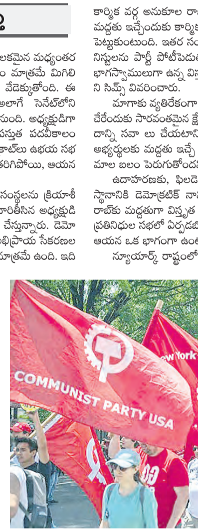
అమెరికాలో కమ్యూనిస్టు పార్టీ పాల్గొనే వ్యక్తులు కమ్యూనిస్టు పార్టీని మద్దతుగా చూపుతున్నారు.

విదాన సభలో అమెరికాలో జరిగిన కీలకమైన మధ్యంతర ఎన్నికలకు కేటాల ఐదు సెలల సమయం మాత్రమే మిగిలి ఉండటంతో, అక్కడి స్థానిక రాజకీయ పరిస్థితి వేదికయింది.