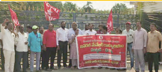
- సింగరేణి జిఎం కార్యాలయం ముందు భారీ దర్శా - కార్యాలయం ముట్టడి