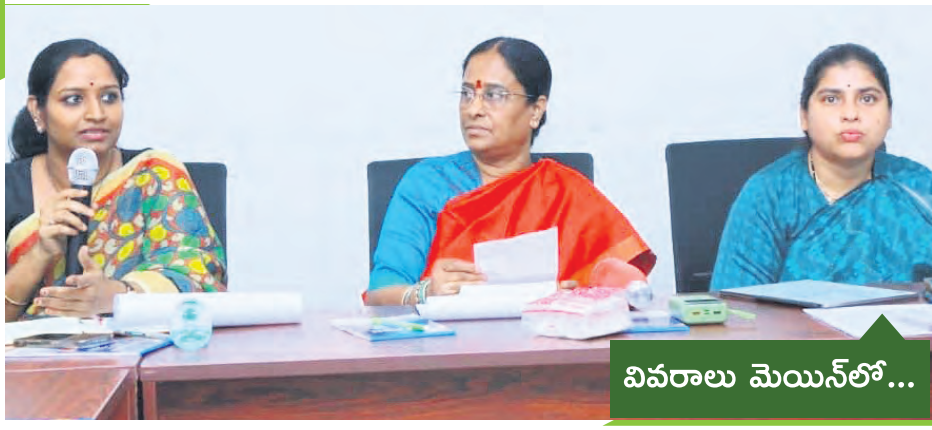
వివరాలు మెయిన్ లో...