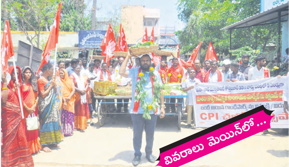
వివరాలు మెయిన్ లో...