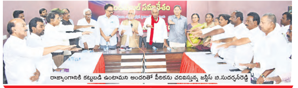
రాజ్యాంగానికి కట్టబడి ఉంటామని అందరితో పీఠికను చదివిస్తున్న జస్టిస్ బి.సుదర్శనరెడ్డి

మోదీ హయాంలో విద్యావ్యవస్థ నాశనం ● యువతరం మూల్యం చెల్లించుకోవాలి వస్తుంది ● నీట్ విద్యార్థిని బలవన్మరణంపై రాహుల్ గాంధీ పైర్ న్యూఢిల్లీ : నీట్ విద్యార్థిని బలవన్మరణంపై లోక్ సభ ప్రతిపక్ష నాయకుడు రాహుల్ గాంధీ కేంద్ర ప్రభుత్వంపై తీవ్ర స్థాయిలో విమర్శలు గుప్పించారు. పదేపదే జరుగుతున్న పీఠిక రీట్ వివాదాల వల్ల విద్యార్థుల కలలు చెదిరిపో తున్నాయని మండిపడ్డారు. గత 12 ఏళ్లగా ప్రధాని విద్యా వ్యవస్థను నాశనం చేసిన తీరుకు యువతరం మొత్తం మూల్యం చెల్లి స్టాంపి అయిన తరువాతి 12లో