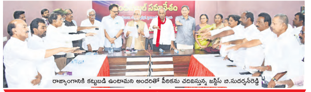
రాజ్యాంగానికి కట్టుబడి ఉంటామని అందరితో పీఠికను చదివిస్తున్న జస్టిస్ బి.సుదర్శనరెడ్డి

మోదీ హయాంలో విద్యావ్యవస్థ నాశనం ● యువతరం మూల్యం చెల్లించుకోవాలి వస్తుంది ● నీట్ విద్యార్థిని బలవన్మరణంపై రాహుల్ గాంధీ పైర్ న్యూఢిల్లీ : నీట్ విద్యార్థిని బలవన్మరణంపై లోక్ సభ ప్రతిపక్ష నాయకుడు రాహుల్ గాంధీ కేంద్ర ప్రభుత్వంపై తీవ్ర స్థాయిలో విమర్శలు గుప్పించారు. పదేపదే జరుగుతున్న పీఠిక రీట్ వివాదాల వల్ల విద్యార్థుల కలలు చెదిరిపో తున్నాయని మండిపడ్డారు. గత 12 ఏళ్లగా ప్రధాని విద్యా వ్యవస్థను నాశనం చేసిన తీరుకు యువతరం మొత్తం మూల్యం చెల్లి స్టాంపి అయిన తరువాతి 12లో