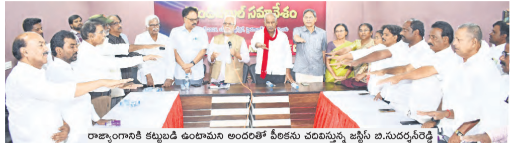
రాజ్యాంగానికి కట్టబడి ఉంటామని అందరితో పీఠికను చదివిస్తున్న జస్టిస్ బి.సుదర్శన్ రెడ్డి

మోదీ హయాంలో విద్యావ్యవస్థ నాశనం ● యువతరం మూల్యం చెల్లించుకోవాలి వస్తుంది ● నీట్ విద్యార్థిని బలవన్మరణంపై రాహుల్ గాంధీ పైర్ న్యూఢిల్లీ : నీట్ విద్యార్థిని బలవన్మరణంపై లోక్ సభ ప్రతిపక్ష నాయకుడు రాహుల్ గాంధీ కేంద్ర ప్రభుత్వంపై తీవ్ర స్థాయిలో విమర్శలు గుప్పించారు. పదేపదే జరుగుతున్న పీఠిక బిక్ వివాదాల వల్ల విద్యార్థుల కలలు చెదిరిపోతున్నాయని మండిపడ్డారు. గత 12 ఏళ్లగా ప్రధాని విద్యా వ్యవస్థను నాశనం చేసిన తీరుకు యువతరం మొత్తం మూల్యం చెల్లిస్తోందని ఆయన తరువాతి 12లో