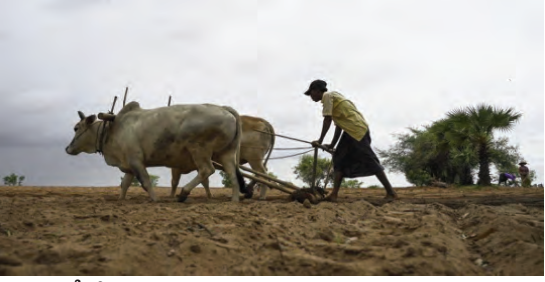
(మొదటిపేజీ తరువాయి) వెంటనే కొనుగోలు కేంద్రాల్లో ఉన్న మొక్కజొన్నలు, ధాన్యాన్ని కాంటాలు వేసి తరలించాలని రైతులు కోరుతున్నారు.

కల్లీని అరికట్టడెలా...? గడిచిన మూడేళ్ళగా కల్లీ విత్తనాలను అరికట్టేందుకు రాష్ట్ర ప్రభుత్వం వ్యవసాయ శాఖ ప్రత్యేక దృష్టి సారించింది. కల్లీ విత్తనదారులపై కఠినంగానే వ్యవహరిస్తున్నప్పటికీ కల్లీ విత్తనాల విక్రయం మాత్రం ఆగడం లేదు. ప్రతి ఏడాది ఎక్కడో ఒక చోట కల్లీ విత్తనాల భారీన పడి రైతాంగం నష్టపోతూనే ఉంది. గతేడాది మిర్చి, ధాన్యం రైతులతో పాటు కొన్ని ప్రాంతాల్లో పత్తి రైతులు కూడా నష్టపోయారు. గ్రామాల్లో పత్తి విత్తనాల