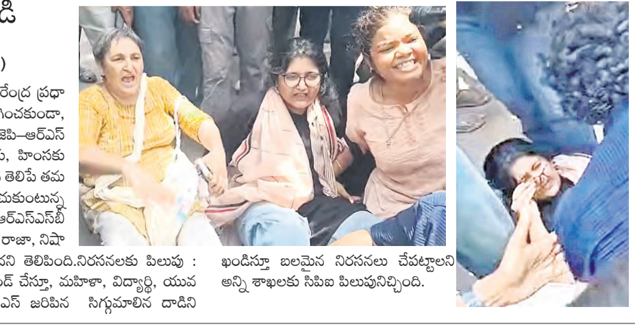
ఖండిస్తూ బలమైన నిరసనలు చేపట్టాలని అన్ని శాఖలకు సీపిఐ పిలుపునిచ్చింది.