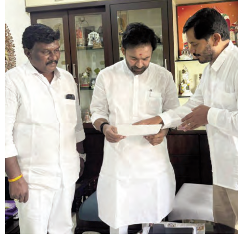
ప్రజాపక్షం / జైసూర్ : నిరుద్యోగ యువతకు జిఎంఆర్