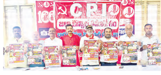
ధరల పెరుగుదలను నియంత్రించాలి

నరం లేకుండా ఈ ఒక్క యాన్ డ్వారానే చెల్లించవచ్చు. ఈ ప్లాట్ ఫోర్మ్ ద్వారా ప్రభుత్వ ఆయా పనులతో మరింత పారదర్శకత, సామర్థ్యం పెరుగడంతో పాటు ప్రజలకు సమయం ఆదా అవుతుంది. రాష్ట్ర రోజుల్లో ప్రభుత్వం నోటిఫై చేసే మరిన్ని పార సేవలను సైతం ఈ యాన్ లో అనుసంధానం చేసేలా డివీ సి ప్రెస్టేజ్ డిజిటల్ గవర్నెన్స్ ఎకస్ ప్లెట్ గా తీర్చిదిద్దారు. ఉప్పల్ లో 100 పడకల ఏరియా ఆనువత్తి మల్కాజిగిరి జిల్లా ప్రజల ఆరోగ్య అవసరాల కోసం ఉప్పల్ లో నూతనంగా నిర్మించిన తలపెట్టి 100 పడకల ఏరియా ఆనువత్తికి ముఖ్యమంత్రి రేవంత్ రెడ్డి శంకుస్థాపన చేయనున్నారు. 0.97 ఎకరాల విస్తీర్ణంలో, రూ. 27.17 కోట్ల వ్యయంతో ఈ అత్యాధునిక ప్రభుత్వ ఆసుపత్రిని నిర్మించనున్నట్లు అధికారులు తెలిపారు. ముఖ్యమంత్రి వర్గం నుండి ఉప్పల్ భగాయత్ పరిసర ప్రాంతాల్లో అధికారులు ఏర్పాటు చేస్తున్నారు.