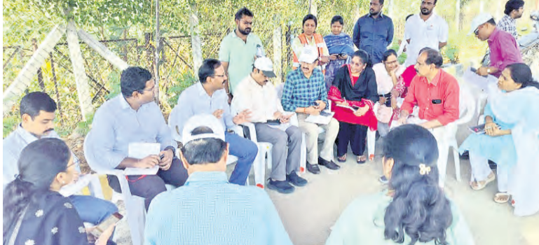
‘క్యూర్-1’ ఆఫ్ డివైఎస్ ఆవిష్కరించునున్న సిఎం... స్నానాల్లో తలముసలకల్పన ఎంఎస్ యంత్రాంగం

ప్రజాపక్షం/హైదరాబాద్/మేడ్రెల్: మల్కాజిగిరి మున్సిపల్ కార్యాలయం (ఎంఎస్ఐ) పరిధిలో భారీ మౌలిక వసతుల కల్పన, ల్యాండ్ మాస్టర్ ప్రాజెక్టులకు ఆదివారం శ్రీకారం చుట్టిన నాడు. ముఖ్యమంత్రి రేవంత్ రెడ్డి నేటి సాయంత్రం 5:00 గంటలకు ఉప్పల్ జిల్లా, ఉప్పల్ భగాయత్ లి అప్పల్ ఫేజీ III వేదికగా నిర్వహించిన ప్రత్యేక కార్యక్రమంలో పాల్గొన్నారు. ఈ సందర్భంగా కార్యాలయ పరిధిలోని పలు ప్రతిష్టాత్మక అభివృద్ధి పనులకు సిఎం శంకుస్థాపన చేయడంతో పాటు, పట్టణ పరిపాలనను మరింత బలోపేతం చేసేందుకు రూపొందించిన ‘క్యూర్-1’ మొబైల్ ఆఫ్ డివైఎస్ ప్రారంభించారు.