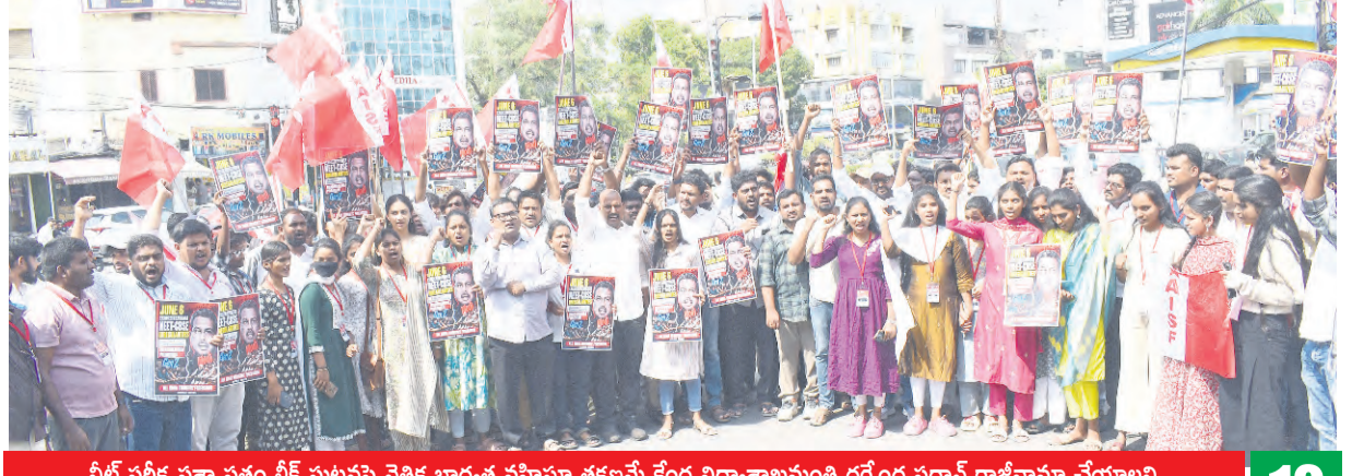
నీటి పరీక్ష ప్రశ్నా పత్రం రీకే ఫుటబిస్ నైతిక బాధ్యత వహిస్తూ తక్షణమే కేంద్ర విద్యాశాఖమంత్రి ధర్మేంద్ర ప్రధాన్ రాజీనామా చేయాలని హిమాచల్ నగర్ 'వై' జంక్షన్ వద్ద ఎబిఎస్ఎఫ్ రాష్ట్ర సమితి ఆధ్వర్యంలో నిరసన

కువైట్-బుహ్రైన్లో అమెరికా స్థావరాలపై క్షిపణి దాడులు : ఐఆర్ఐసి ప్రకటన అమెరికా-ఇరాన్ మధ్య కొనసాగుతున్న దాడులు కైరో: ఇరాన్-అమెరికా మధ్య పరస్పర దాడులు కొనసాగుతున్నాయి. హోర్నుజ్ జలసంస్థానికి అనుమతి లేకుండా ప్రవేశించేందుకు ప్రయత్నం చేసే ట్యాంకర్లపై కాల్పులు జరిపామని, గల్ఫ్ ఆఫ్ ఓమన్లో అమెరికా యుద్ధ నౌకకు హెచ్చరికలు చేస్తూ క్షిపణి దాడులు చేశామని, కువైట్,బుహ్రైన్ లో కూడా అమెరికా స్థావరాలపై దాడులు చేసినట్లు ఐఆర్ఐసి ప్రకటించింది. లెబనాన్ నుండి ఇజ్రాయెల్ వైదొలగడంతోకాక పశ్చిమాసియాలో శాంతి సాధ్యం కాదని ప్రకటించింది. ఇరాన్ కోస్తా తీర ప్రాంతంలో ఉన్న రాదార్ కేంద్రంపై అమెరికా దాడులు చేసింది. గోరకలోని లక్ష్యాల్పై తరువాయి 8లో