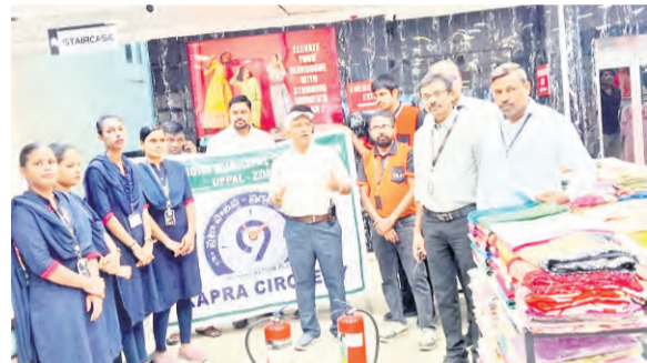
ఆగ్ని ప్రమాదాల నివారణపై అవగాహన