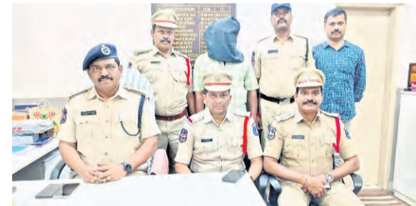
మహిళా దారుణ హత్య