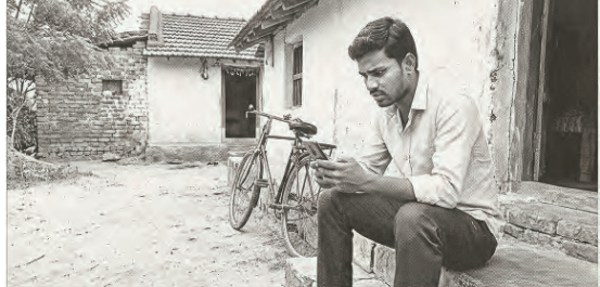
వాట్సాప్ స్టేటస్.. 'మానసిక' రోగిని గ్రామీణ యువతలో ఆందోళన.

వాట్సాప్ స్టేటస్లతో పెరుగుతున్న మానసిక రోగులు..!