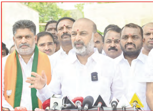
కరీంనగర్ మీడియాతో కేంద్ర మంత్రి బండి సంజయ్ కుమార్