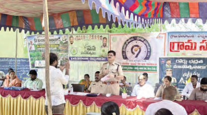
చేయడం, తల్లిదండ్రులను బెదిరించడం, అవసరం లేని డిమాండ్లు చేయడం, మానసిక ఒత్తిడి గురిచేయడం వంటి లక్షణాలు కనిపిస్తే వెంటనే అప్రమత్తం కావాలని సూచించారు. అటువంటి పరిస్థితుల్లో తల్లిదండ్రులు భయపడకుండా సమీప పోలీస్ స్టేషన్లను సంప్రదించాలని, పోలీసులు అవసరమైన కౌన్సెలింగ్ అందించడమే కాకుండా వైద్య నిపుణులు, మనోవైద్యుల సహాయంతో పిల్లలను సరైన మార్గంలో నడిపించేందుకు చర్యలు తీసుకుంటారని తెలిపారు. యువతను డ్రగ్స్ బారిన పడకుండా కాపాడటం, ఆరోగ్యకరమైన సమాజ నిర్మాణం ప్రభుత్వంతో పాటు ప్రతిపౌరుడి బాధ్యత అని డి.సి.పి పేర్కొన్నారు. ఈ కార్యక్రమంలో ఎస్.ఎస్.ఆర్.గో. శాఖ అధికారులు, వ్యవసాయశాఖ అధికారులు, విద్యాశాఖ ప్రధానోపాధ్యాయులు, నీటిపారుదల శాఖ అధికారులు, విద్యుత్ శాఖ సహాయ ఇంజనీర్, తదితరులు పాల్గొన్నారు.

ప్రజాపక్షం/పెద్దపల్లి రూరల్ : యువతను డ్రగ్స్ బారిన పడకుండా కాపాడడం మన అందరి బాధ్యత అని పెద్దపల్లి డి.సి.పి బి రామ్ రెడ్డి అన్నారు. బుధవారం రోజున ప్రజా పాలన ప్రగతి ప్రణాళిక 99 రోజుల కార్యచరణలో భాగంగా ప్రభుత్వం నిర్వహిస్తున్న గ్రామసభల్లో భాగంగా, రామగుండం పోలీస్ కమిషన్ రేట్ పెద్దపల్లి జోన్ పరిధిలోని హనుమంతునిపేట గ్రామంలో నిర్వహించిన గ్రామసభకు పెద్దపల్లి డి.సి.పి బి.రామ్ రెడ్డి ముఖ్య అతిథిగా హాజరయ్యారు. పోలీస్ శాఖ ఆధ్వర్యంలో నిర్వహిస్తున్న ఆర్ఎంఆర్ఎస్ కార్యక్రమంలో భాగంగా రోడ్డు భద్రతా నియమాలు, రోడ్డు సేఫ్టీ, హెల్మెట్ వినియోగం, సీట్ బెల్ట్ ధరించడం, నిర్లక్ష్యపు డ్రైవింగ్, మెనార్ డ్రైవింగ్, గంజాయి మరియు ఇతర మత్తు పదార్థాల వినియోగం వల్ల కలిగి దుష్పరిణామాలపై అవగాహన కల్పించారు. ఈ సందర్భంగా డి.సి.పి మాట్లాడుతూ, పిల్లల భవిష్యత్తును తీర్చిదిద్దడంలో తల్లిదండ్రులు, ఉపాధ్యాయుల పాత్ర అత్యంత కీలకమని అన్నారు. తల్లిదండ్రుల పట్ల గౌరవం, గురువుల పట్ల భక్తి కలిగిన విద్యార్థులు జీవితంలో ఉన్నత స్థాయికి చేరుకునే అవకాశాలు ఎక్కువగా ఉంటాయన్నారు. ప్రస్తుతం మాదకద్రవ్యాల వ్యవసం యువతను తీవ్రంగా ప్రభావితం చేస్తోందని, డ్రగ్స్ కు అలవాటు పడిన పిల్లల్లో ప్రవర్తనలో స్పష్టమైన మార్పులు కనిపిస్తాయని తెలిపారు. ఇంట్లో నవ్వులు ధ్వంసం